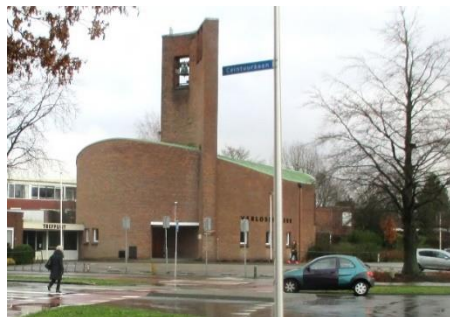
Gloabaal plan / Foto