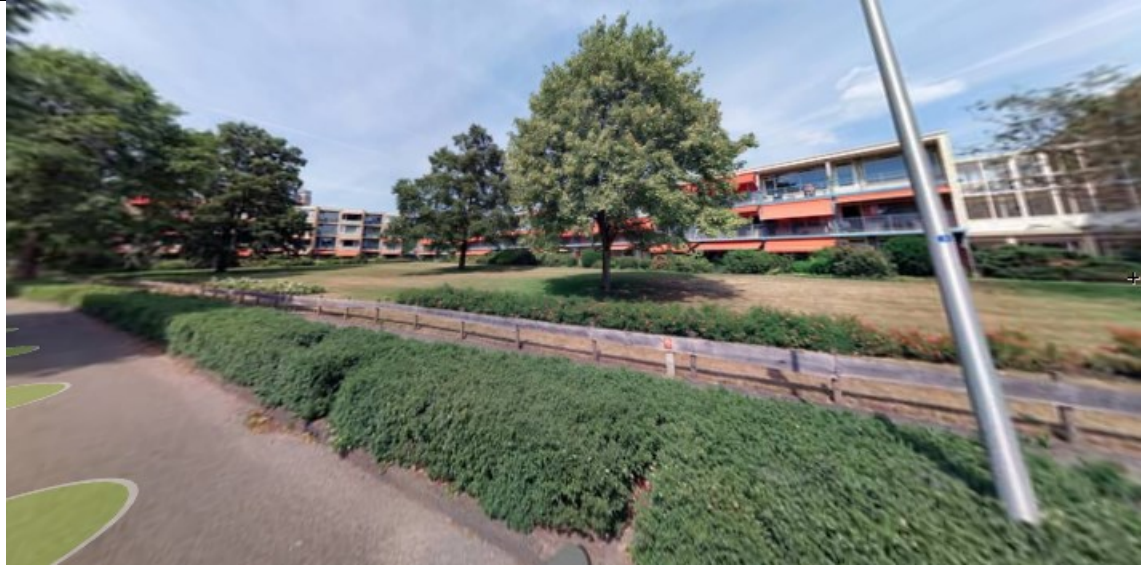
Globaal plan / Foto