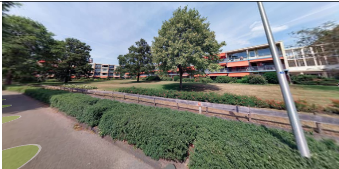
Globaal plan / Foto