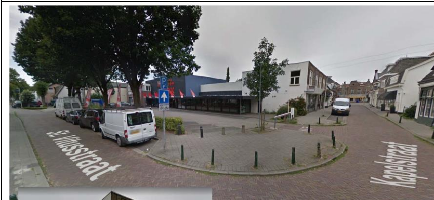
Globaal plan / Foto