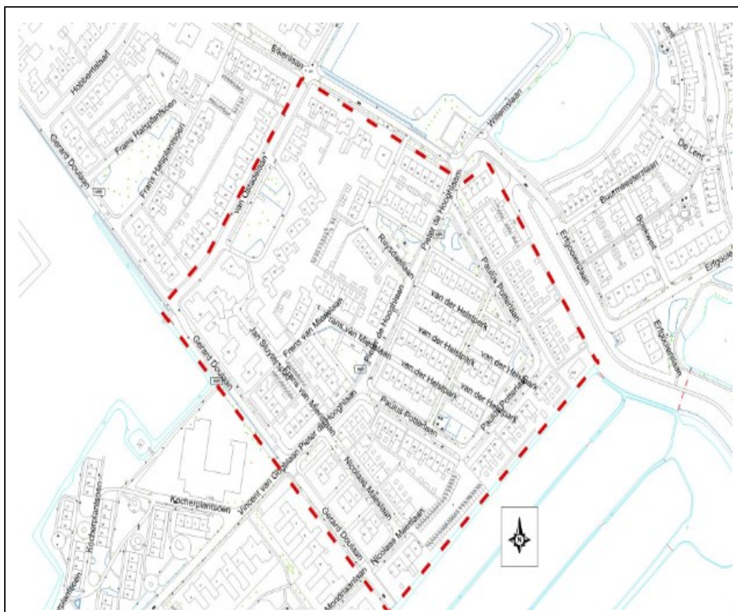
Plangebied Van der Helstpark en omgeving

Volg het project ook via onze website gooisemer.nl/vanderhelstpark . Heeft u vragen of opmerkingen? Vul dan het reactieformulier "Stel een vraag" in op gooisemer.nl/vanderhelstpark .