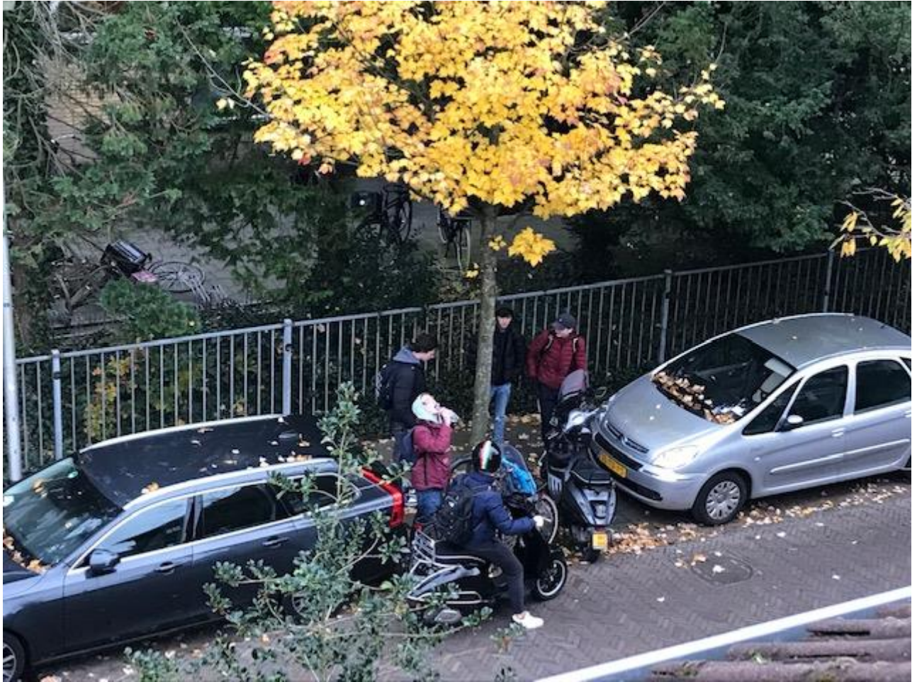
Leerlingen staan met scooters op straat, na school en in eventuele tussenuren, zodat er geen grote auto's meer langs kunnen, zeker niet als er ook nog fietsende leerlingen richting Vondellaan gaan.