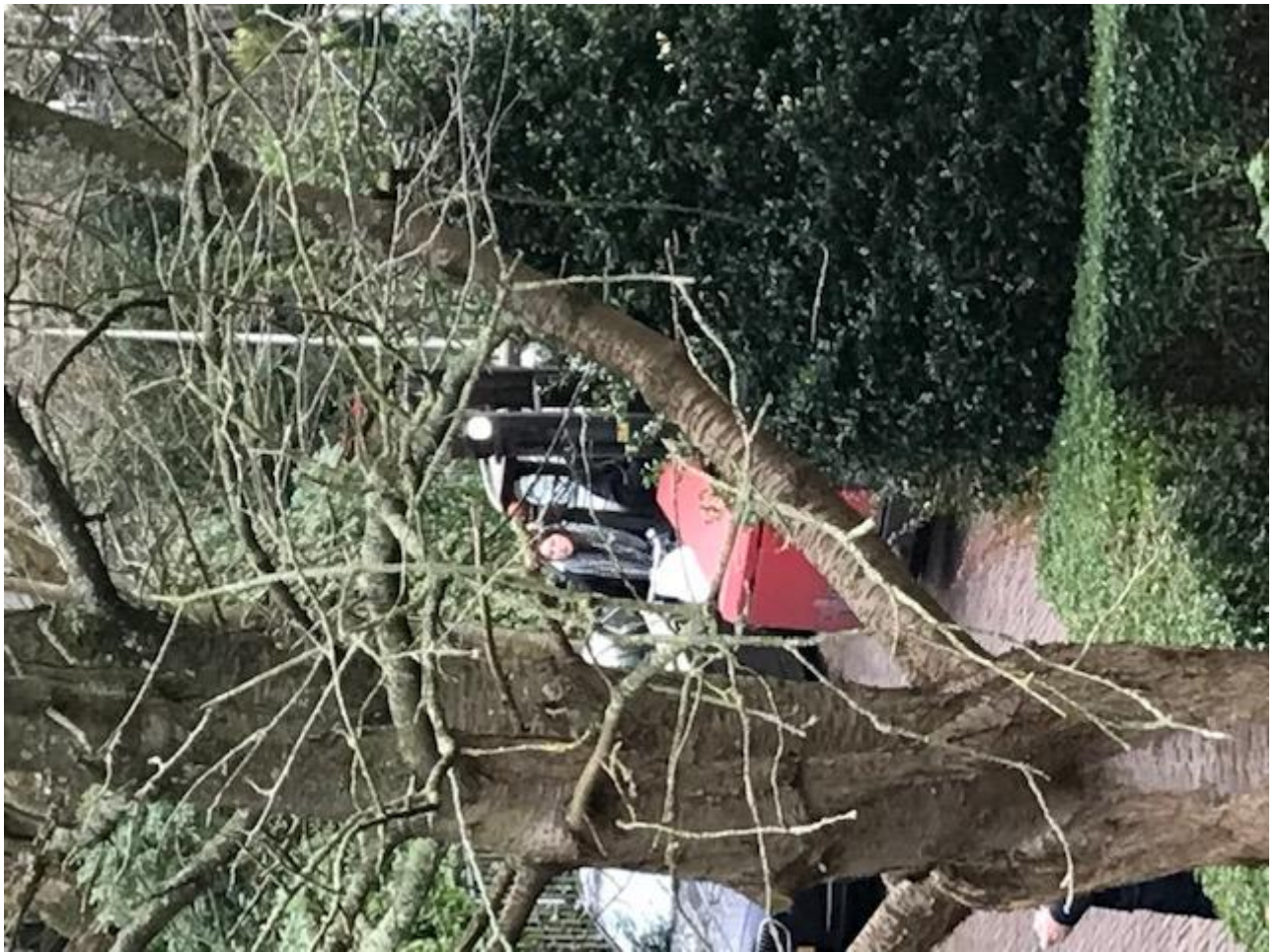
Een vorktruckhefwagentje dat achteruit door onze straat reed en bijna een fietser raakte, die zich aan de linker kant probeerde erdoor te wurmen!