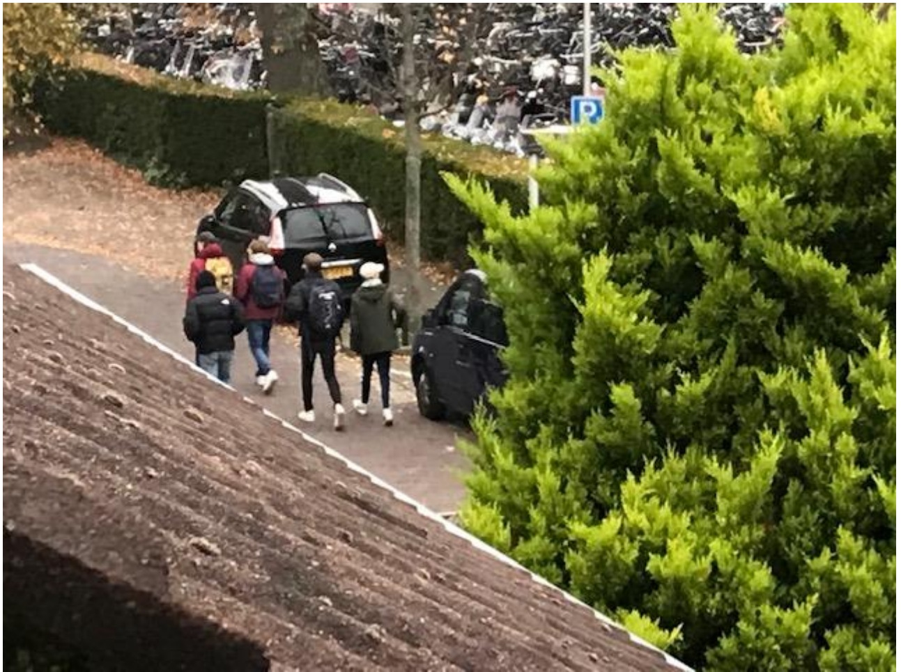
Alle leerlingen lopen ook altijd op straat, nauwelijks op de stoep.