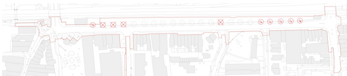
Figuur 2: Locatie te verplanten en kappen bestaande bomen

De bomen en de haag worden in de week van 28 februari (week 8) en 7 maart verwijderd (week 9). In totaal worden er vier bomen gekapt en zes tijdelijk verplant: in figuur 2 is aangegeven om welke bomen het gaat. Deze bomen komen ook weer terug in de nieuwe situatie. Daarnaast komen er circa 20 extra bomen bij.