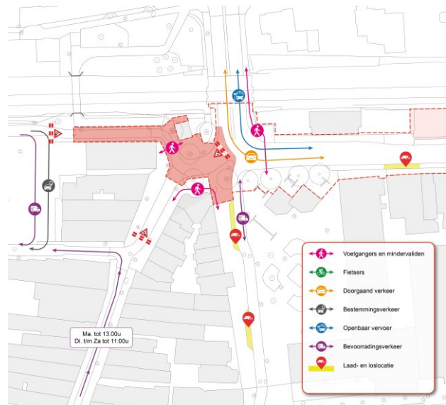
Figuur 3: Situatie tijdens fase 2

De werkzaamheden starten op 14 maart en nemen circa 4 weken in beslag.