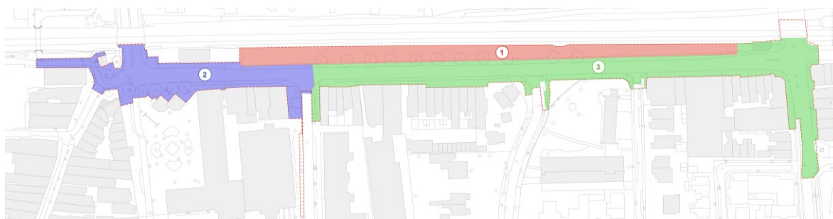
Figuur 1: Indeling werkzaamheden Vlietlaan