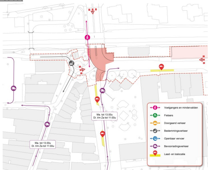
Figuur 4: Situatie tijdens fase 3

Deze werkzaamheden zullen halverwege april starten en nemen circa 3 weken in beslag. .