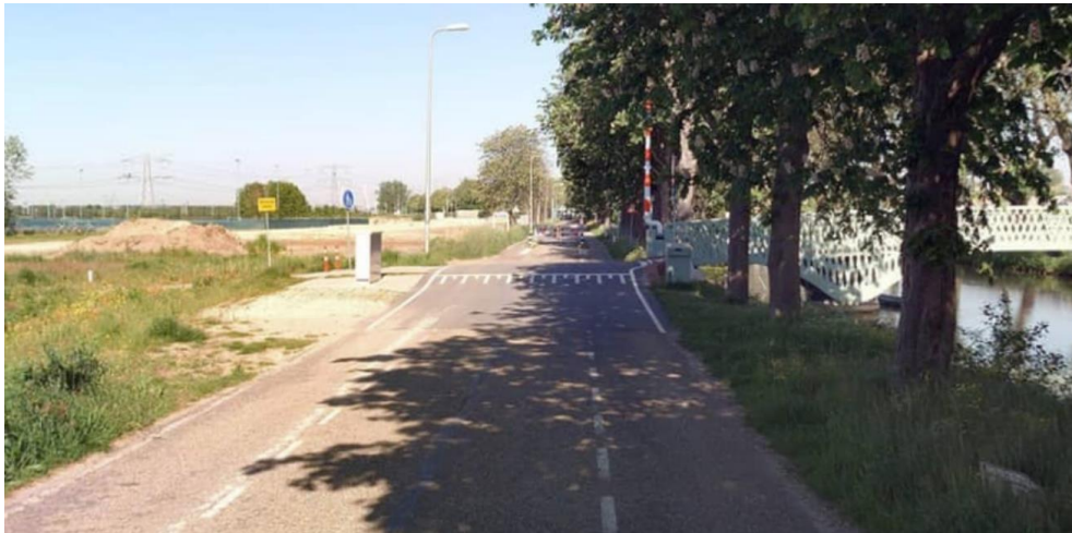
Figuur 1: Situatie bij de fietsbrug over de Muidertrekvaart

In hoofdlijnen zijn er in de participatie drie opties benoemd om de situatie veiliger te maken (al dan niet in combinatie met elkaar mogelijk):