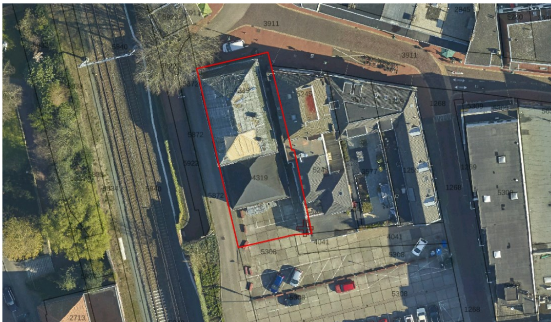
Figuur 1: Luchtfoto Nassaulaan 43-45