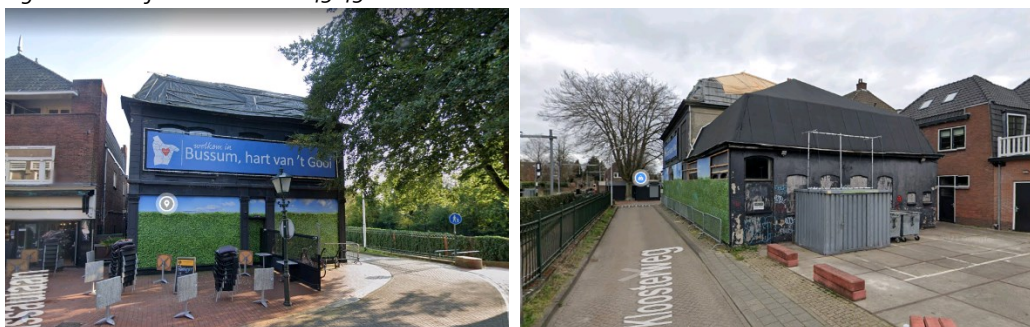
Figuur 2: Foto's voor- en achterzijde pand 'De Vonk'.