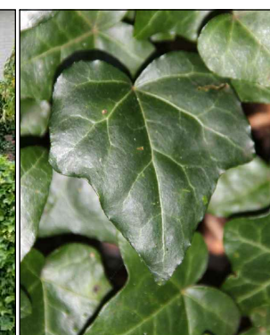
Hedera Helix (klimop) Codering: GW2