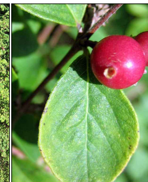
Symphoricarpos x chenaultii 'Hancock' (sneeuwbes) Codering: HJS1, OP1