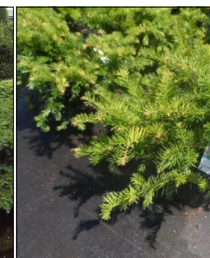
Taxus baccata 'Repandens' (venijnboom) Codering: KL1