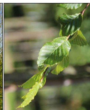
Carpinus betulus 'Frans Fontaine' (haagbeuk) Codering: Cb