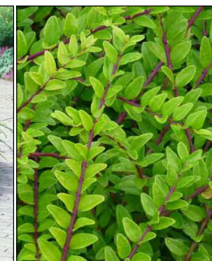
Lonicera nitida 'Maigrun' (Struikkamperfoelie) Codering: GL1, GW1