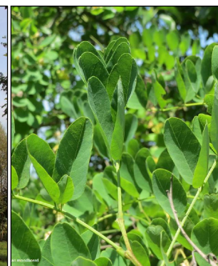
Robinia pseudoacacia (valse acacia) Codering: Rp