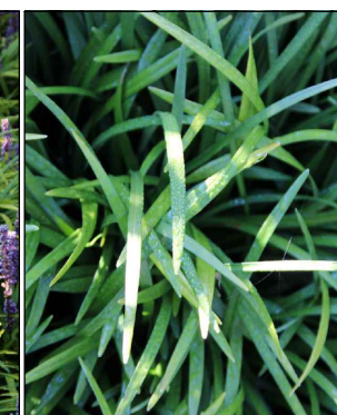
Liriope muscari 'Ingwersen' (Leliengras) Codering: LSH2