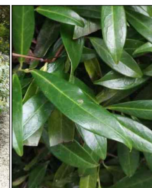
Prunus laurocerasus 'Zabeliana' (laurierkers) Codering: MW1, GW3