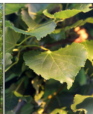
Tilia cordata 'Rancho' (winterlinde) Codering: Tc