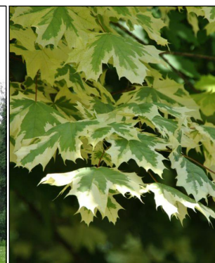
Acer platanoides 'Drummondii' (Noorse esdoorn) Codering: Ap