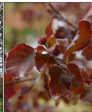
Fagus sylvatica 'Atropunicea' (rode beuk) Codering: Fs