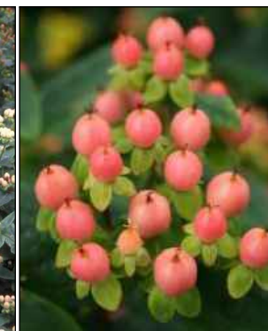
Hypericum Inodorum 'Orange Gem' (hertshooi) Codering: MW1