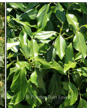
Hedera colchica 'Fall Favourite' (struikklimop) Codering: LL1