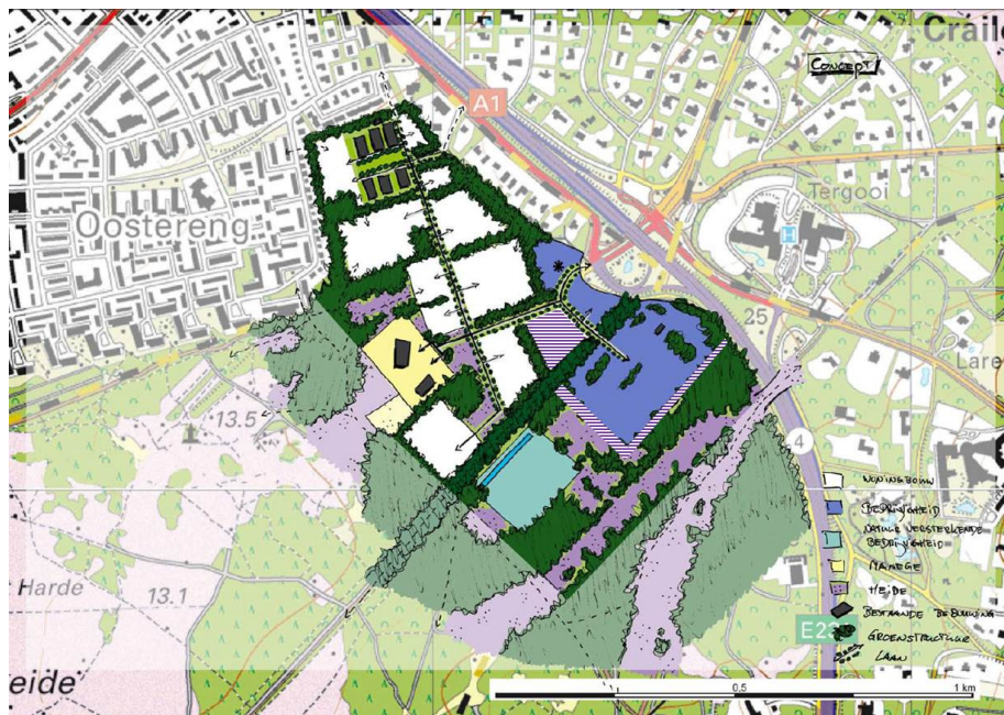
Ruimtelijk kader met globale programmatische invulling dd 23 oktober 2013

(2,5 ha). De ontwikkelkamers kunnen verder fasegewijs in ontwikkeling worden genomen voor projectmatige of particuliere initiatieven. Hieronder staat de aangepast verbeelding.