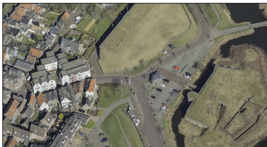
Figuur 4.1: Huidige invulling Vestingplein

Vanuit het programma Verder met de Vesting ligt er voor het Vestingplein de ambitie om de historische uitstraling terug te brengen en de ruimtelijke kwaliteit te verbeteren. Op dit moment wordt het gehele Vestingplein als parkeerterrein gebruikt (zie ook figuur 4.1).