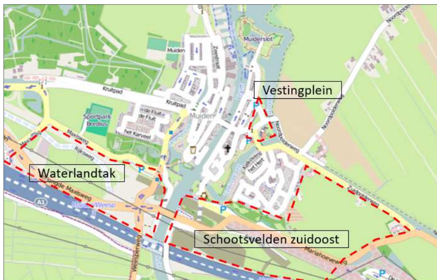
Figuur 1.1: Oriëntatiegebied