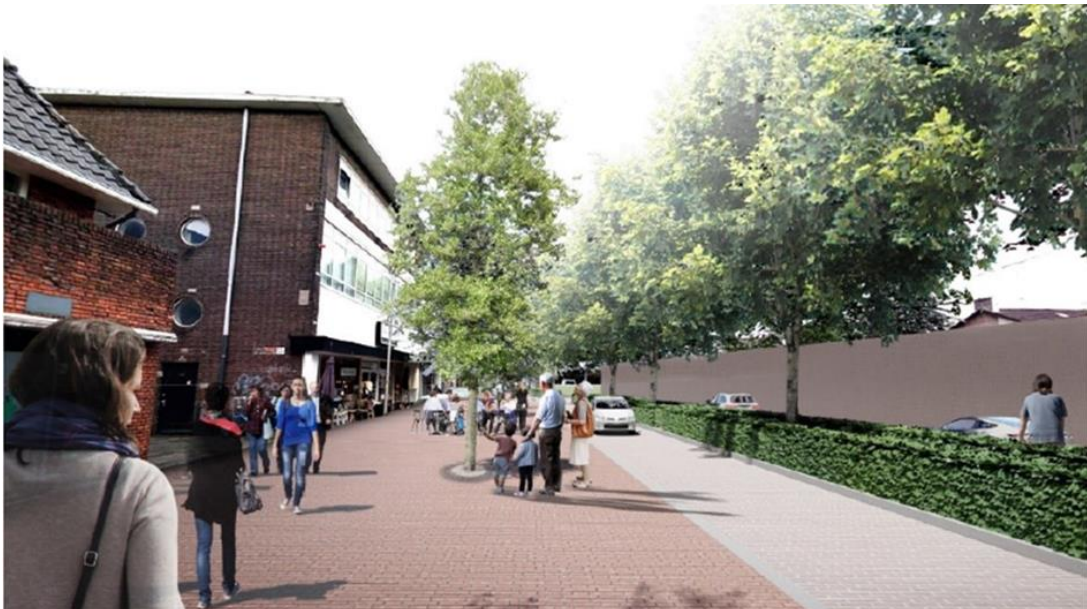
Afbeelding 2. Impressie nieuwe wegingdeling Vlietlaan

Het verkeer in de richting van de Generaal de la Reijlaan rijdt aan de andere zijde tussen de bomenrij en het nieuw aan te leggen brede trottoir. Het scheiden van de rijrichtingen heeft net als het toepassen van plateaus op de kruispunten een positief (afremmend) effect op de snelheid van het verkeer en verbetert de oversteekbaarheid van de weg. De gekozen wegingdeling geeft ten opzichte van de eerder gepresenteerde varianten de meeste ruimte om het trottoir aan de zijde van de winkels te verbreden en kwaliteit toe te voegen aan de openbare ruimte. Het gaat dan om kwaliteit in de vorm van een extra groenstructuur, meer ruimte voor voetgangers en aanvullende functies zoals uitstallingen en terrassen. Hiermee wordt invulling gegeven aan de doelstelling om de Vlietlaan in te richten als hoogwaardige entree voor het centrum van Bussum.