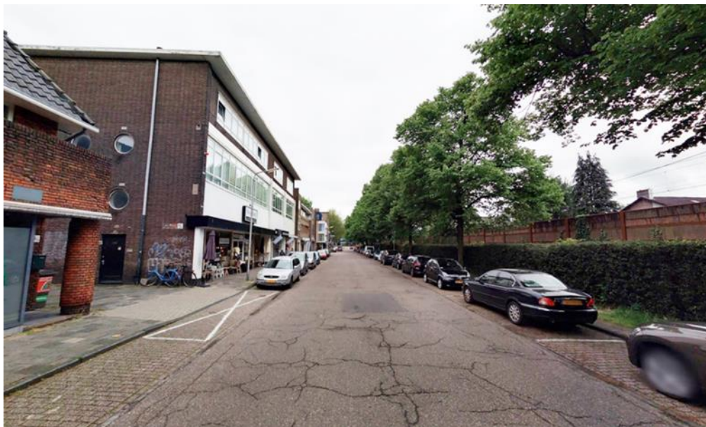
Afbeelding 1: Huidige situatie Vlietlaan

De Vlietlaan heeft samen met de Stationsweg een belangrijke functie als entree voor het centrum. Met het herinrichten van de Vlietlaan creëren we een prettige leefomgeving en een aantrekkelijke entree naar het centrum van Bussum vanuit het stationsgebied. De herinrichting geeft kansen om de Vlietlaan beter aan te laten sluiten bij het centrum, het winkelklimaat te verbeteren en in de openbare ruimte een kwaliteitsslag te maken. Daarnaast heeft de herinrichting als doel het verbeteren van de verkeersveiligheid (waaronder veiligheid en doorstroming bij de overwegen), het optimaliseren van het parkeren (ook laden en lossen) en het efficiënt inrichten van de verblijfsruimte (looproute en zichtlijn naar het centrum, mogelijkheid voor uitstallingen, terrassen, fietsparkeren en ondergrondse afvalcontainers). De onderhoudstrook van ProRail tussen het geluidsscherm en de bestaande bomenrij op de Vlietlaan betrekken we bij de nieuwe inrichting van de Vlietlaan.