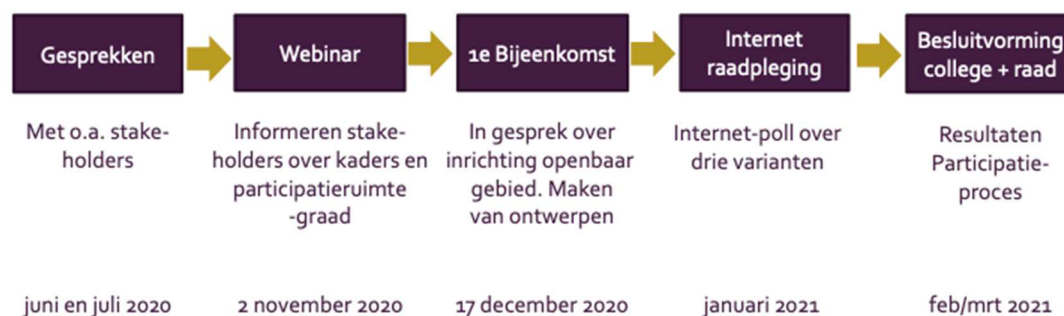
Figuur 2: Groeiplan voor participatie

In de hoofdstukken 3 tot en met 5 worden de stappen uit het groeiplan verder beschreven.