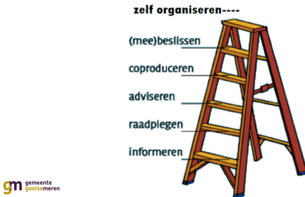
Figuur 1: participatieladder voor bepalen participatiegraad