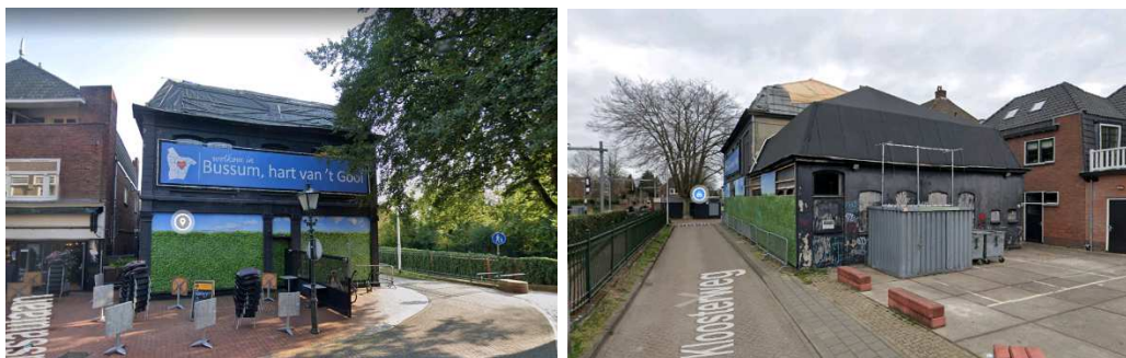
Figuur 2: Foto's voor- en achterzijde pand 'De Vonk'.