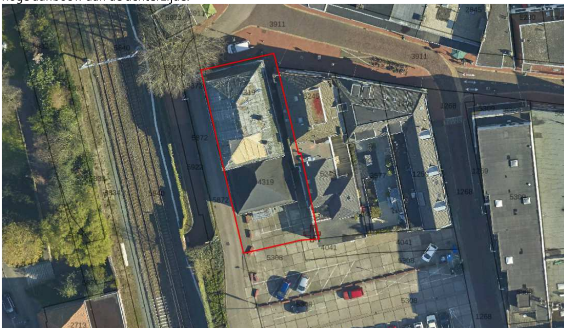
Figuur 1: Luchtfoto Nassaulaan 43-45

Het vrijstaande pand 'De Vonk' is gelegen aan de Nassaulaan 43-45 in het centrum van Bussum en kan worden bereikt via de Vlietlaan of de Kloosterweg. Het perceel is volledig in eigendom van de gemeente Gooise Meren. Het pand bestaat uit een drie lagen hoog hoofdgebouw met een twee lagen hoge aanbouw aan de achterzijde.