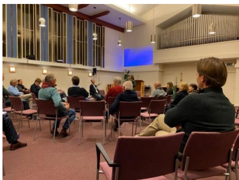
Afbeelding 2: startbijeenkomst 4 november 2021

Aansluitend is een enquête opgesteld om extra informatie uit de samenleving op te halen. Gelijktijdig was het voor geïnteresseerden mogelijk om zich aan te melden voor een werkgroep die samen met de gemeente de visie zou opstellen.