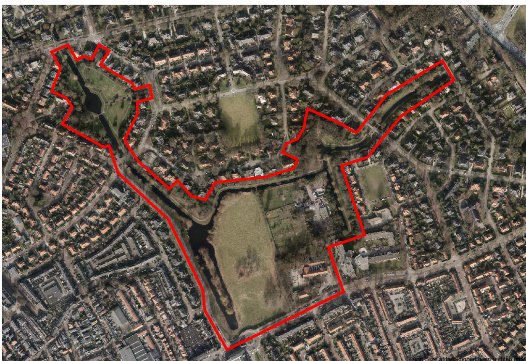
Afbeelding 1: het plangebied

We gaan voor deze opgave uit van het huidige aaneengesloten parkgebied. Dat is het rood omcirkelde gebied in onderstaande afbeelding.