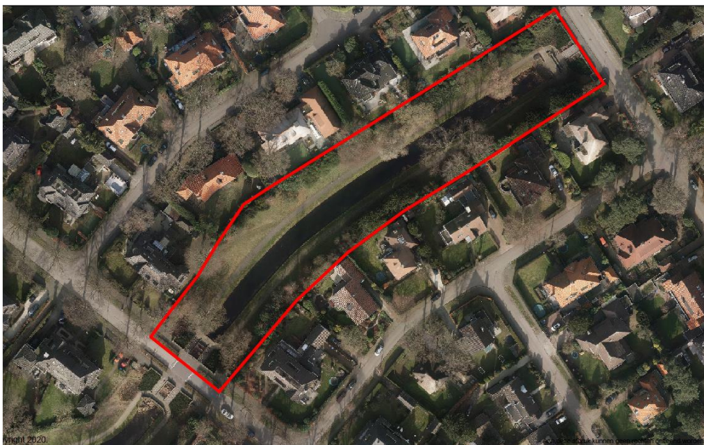
Afbeelding 4: deel van het gebied dat is beschermd als gemeentelijk monument

Het deel met een smalle, iets gebogen, waterloop en trappartijen, tussen de Burgemeester 's Jacoblaan en de Obrechtlaan, is beschermd als gemeentelijk monument. De bescherming houdt in dat eventuele wijzigingen aan de structuur van het park, het groen en de gebouwde elementen, die verder reiken dan gewoon onderhoud, worden getoetst via een omgevingsvergunning.