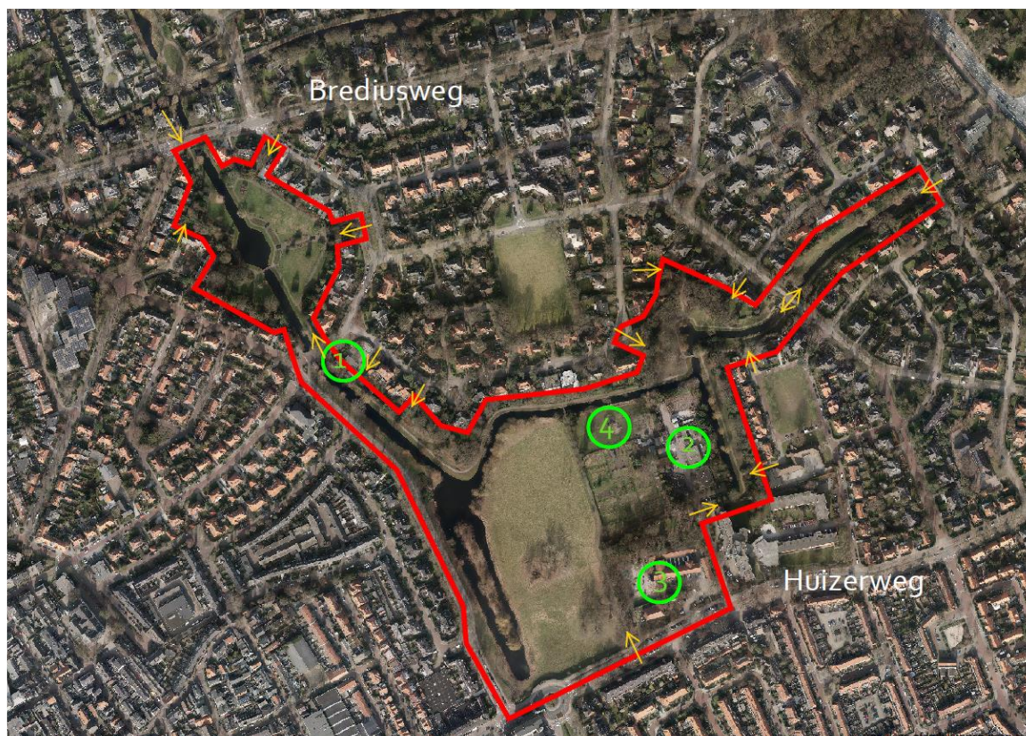
Afbeelding 5: locaties (groen) die bij wijzigingen weer onderdeel moeten worden van het parkgebied en de vele ingangen van het parkgebied (in geel)

Hoewel deze visie gaat om het parkgebied zoals opgenomen in afbeelding 1 op blz. 5, behelst het ontwerp van Tersteeg een veel groter gebied. Het park is als wezenlijk onderdeel van het gehele Brediuskwartier ontworpen. In de loop der jaren is het park kleiner geworden en zijn verbindingen verloren gegaan zoals ook in het cultuurhistorisch onderzoek naar voren komt. Bij veranderingen in de directe omgeving van het parkgebied moet altijd een beoordeling plaatsvinden om te bepalen in hoeverre bij de verandering herstel van het park mogelijk is. Dit geldt bijvoorbeeld voor het terrein van de school (1), de gemeentewerf (2), de zorginstelling (3) of de kinderboerderij (4).