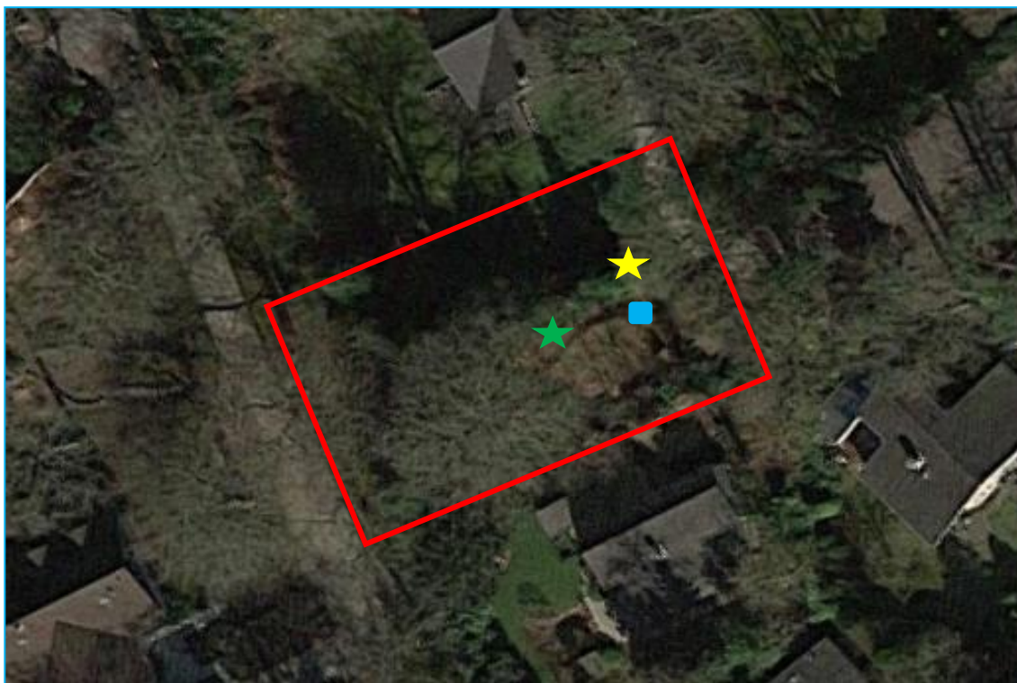
Afbeelding 1: Ligging plangebied. Groene ster: 1 ste locatie struikrover, gele ster 2 de locatie struikrover, blauwe blok: cameraval.

De initiatiefnemer is voornemens een vrijstaande woning te realiseren op het perceel. In dit kader heeft EcoTierra- ecologisch adviesbureau op 13 maart 2019 een quickscan flora en fauna uitgevoerd op deze locatie. Uit de quickscan kwam naar voren dat het niet uit te sluiten was dat kleine marterachtigen, steenmarter en mogelijk boommarter voorkomen binnen het plangebied. Conclusie van de quickscan was dat er met behulp van een cameraval/ struikrover bepaald diende te worden of marterachtigen voorkomen binnen het plangebied. Er is gekozen voor het plaatsen van een struikrover omdat deze methode tot op heden een van de beste methodes is gebleken om kleine, snelle marterachtigen te kunnen vastleggen.