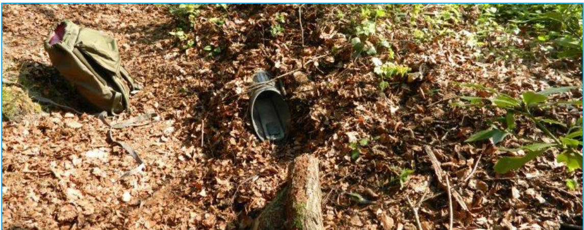
Foto: geplaatste struikrover.

Ook in deze periode zijn geen waarnemingen, op beide camera's, van kleine marterachtigen gedaan. Wederom betroffen de waarnemingen met name bruine rat, hond, muizen en verschillende vogelsoorten.