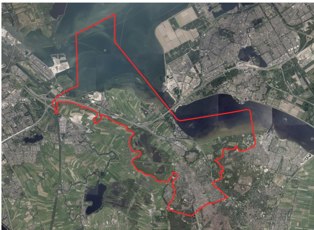
Luchtfoto met gemeentegrens

Dit paraplubestemming beslaat het volledige grondgebied van de gemeente Gooise Meren, met uitzondering van de delen waarvoor geen onderzoeksverplichting geldt. Op navolgende luchtfoto is het gemeentelijk grondgebied van de gemeente Gooise Meren aangegeven.