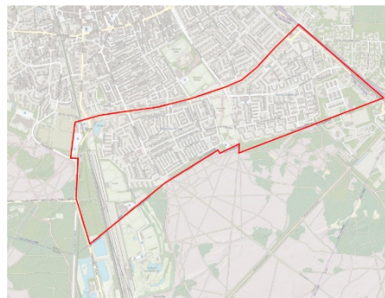
Figuur 1 - De fysieke afbakening van Bussum Zuid

De gebiedsvisie schetst het beeld van de toekomst van Bussum Zuid. Na het doornemen van de visie heeft de lezer een goed beeld van die toekomst, zonder dat dit daarbij tot op detailniveau al is ingevuld. In de visie wordt bijvoorbeeld wel aangegeven dat in de zone rondom het NS station de woonmogelijkheden verder ontwikkeld worden, maar er is geen beschrijving hoe dit eruit ziet. In de visie wordt bijvoorbeeld wel aangegeven wat mogelijke bouwhoogtes zijn voor verschillende delen van de buurt, maar er is geen planologisch ontwerp waarop dit is ingetekend. De gebiedsvisie geeft hoofdlijnen, uitgangspunten en kaders waarbinnen toekomstige initiatieven een plek kunnen krijgen. Met de gebiedsvisie laten we zien hoe de buurt eruit komt te zien, wat we belangrijk vinden in de buurt, wat het karakter wordt en hoe de leefomgeving in de buurt aantrekkelijker wordt gemaakt.