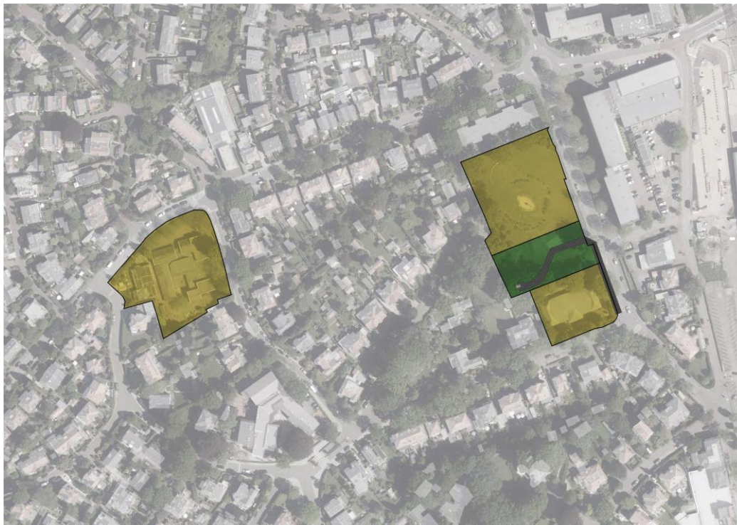
1 Plangebied Emmalocaties

De gemeente wil een nieuwe invulling geven aan deze 'Emmalocaties':