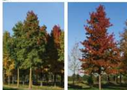
zomerbeeld herfstbeeld eigenschappen: 20-25m hoog, levendige herfstkleur