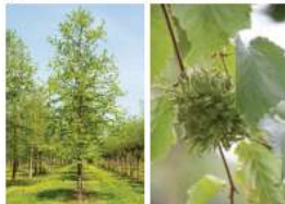
zomerbeeld vrucht eetbaar eigenschappen: 15-20m hoog, mogelijk meerstammig