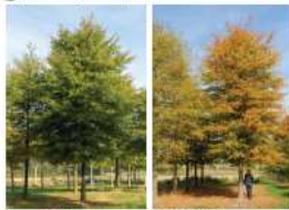
zomerbeeld herfstbeeld eigenschappen: half bladhoudend, 15-20m hoog