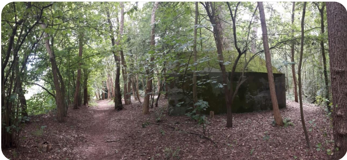
Fig 2. De groepsschuilplaats ongeveer op de plek van een uitkijktoren met zicht op de Zuiderzee

De verscheidenheid aan beplanting, de ruimtelijke overgangen in beplanting, aanwezigheid van bomen in diverse leeftijdsstadia en de aanwezigheid van dood hout bieden voedsel, nestel- en schuilgelegenheid voor de fauna.