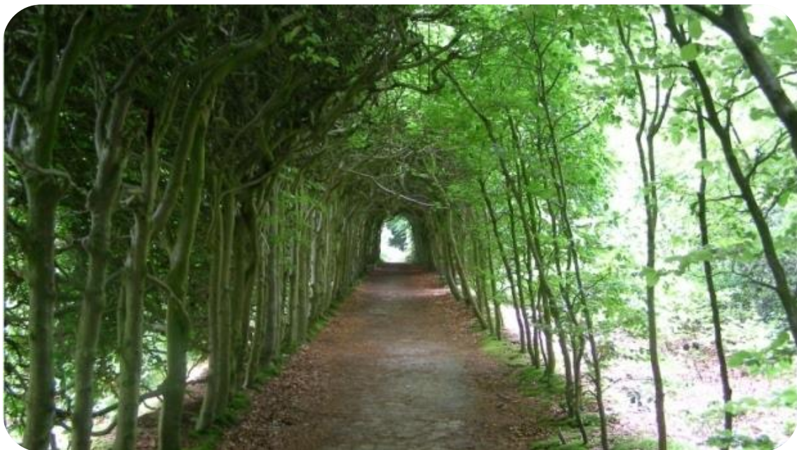
Fig. 5 Voorbeeld berceau