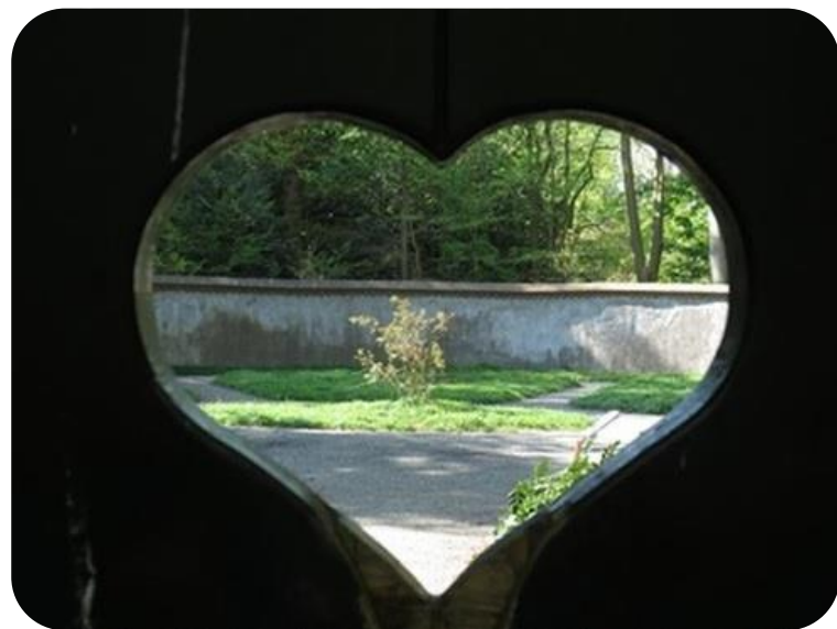
Fig 1 Het Hartjesbos