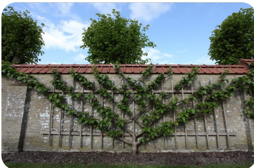
Fig. 7 voorbeeld leifruit langs muur

"Meer bankjes die goed zitten, zodat meer mensen daar lekker kunnen zitten!"