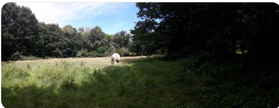
Fig. 4 Weiland als verblijf- en ontmoetingsplek met kansen voor mantelzoombeplanting en ecologisch maaibeheer