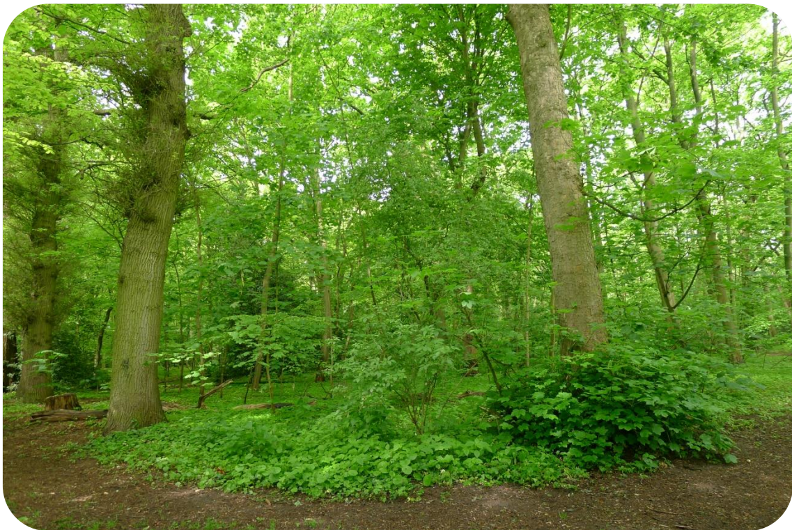
Fig. 6 Laanbomen langs kronkelige hoofdpaden