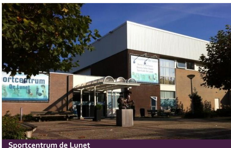
Sportcentrum de Lunet