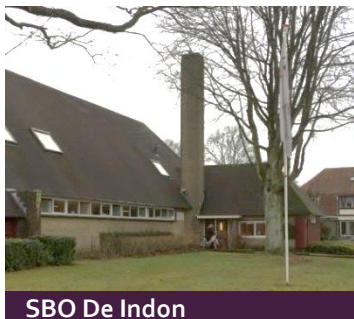
SBO De Indon

De gemeente is op grond van de onderwijswetgeving verantwoordelijk voor onderwijshuisvesting voor het primair, voortgezet en speciaal onderwijs. Afwijkend van de normale privaatrechtelijke verdeling is de gemeente economisch eigenaar van de onderwijsgebouwen en de scholen zijn juridisch eigenaar.