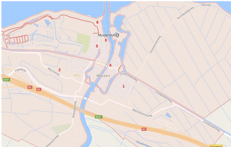
Bijlage 3: Sportaccommodaties Muiden en Muiderberg