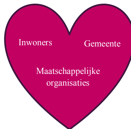
Figuur 2 Verbinding tussen netwerken

Om het programma doe-democratie tot een succes te maken is het van belang dat de organisatie en ook de samenleving gericht zijn op verbinden. Door verbinding ontstaat een samenwerking tussen inwoners/ondernemers, maatschappelijke partners en de gemeente, waarbij de gemeente op veel vlakken steeds meer een ondersteunende rol heeft.