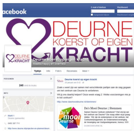
Figuur 3 Online platform Deurne

Voor de initiatievenwebsite vragen we lokale bewonersgroepen en ondernemers om een hun idee te presenteren (pitchen). Hiervoor geven we een beperkt aantal kaders mee. Het winnende idee krijgt een budget om dit uit te werken naar een werkend, interactief platform voor en door bewoners.