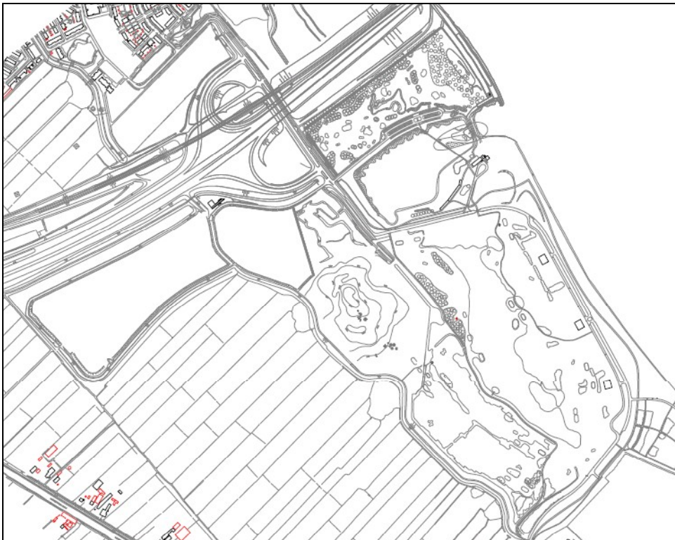
Figuur 4: definitief ontwerp golfbaan, met golfeiland

Het ontwerp van de golfbaan is de afgelopen jaren enigszins aangepast. Zo is er een duidelijker beeld ontstaan van de aan te leggen golfbaan. De bestemmingsplankaart zal op basis van de laatste tekeningen aangepast worden. Dit is voornamelijk te zien in de toevoeging van het golfeiland en de aanpassingen van de waterlijn van het grote meer. Het laatste ontwerp van de golfbaan is hieronder aangegeven. Het golfeiland bevindt zich in de noordoosthoek van het plangebied, op de bestemmingsplankaart is het eiland aangegeven met de bestemming Dagrecreatiedoeleinden.