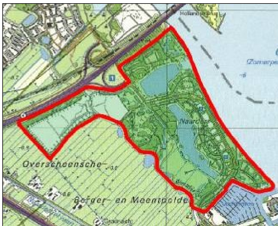
Figuur 2 Ligging van het bestemmingsplangebied ingezoomd

gebied met zijn begrenzingen is weergegeven in figuur 1. Figuur 2 geeft een ingezoomd beeld.