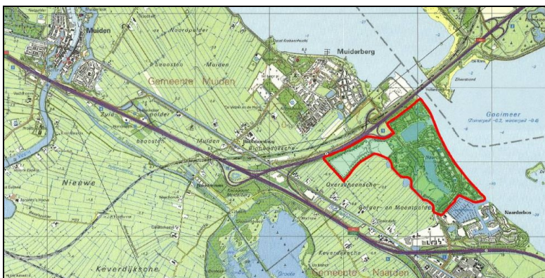
Figuur 1 Plangebied in de omgeving

Het plangebied van het bestemmingsplan Recreatiepark Naarderbos ligt in de Provincie Noord-Holland en is te vinden tussen de plaatsen Naarden en Muiderberg.