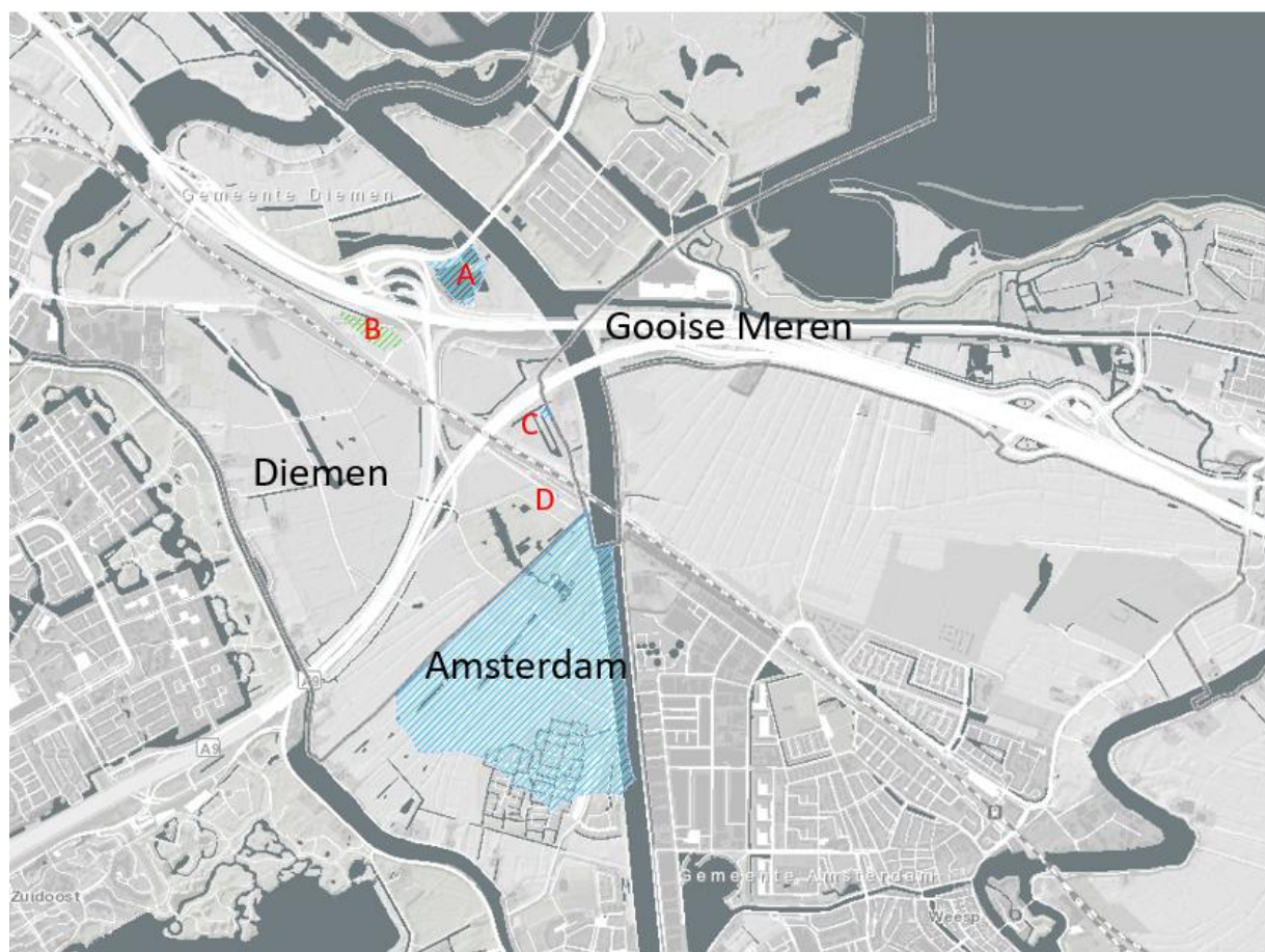
Wind- zoekgebieden Diemen (A, B, C en D) en Amsterdam (bij Driemond).

Inwoners uit Diemen en omliggende gemeenten. Uitnodigingen worden in samenwerking met uw ambtenaren ook in Gooise Meren verspreid.