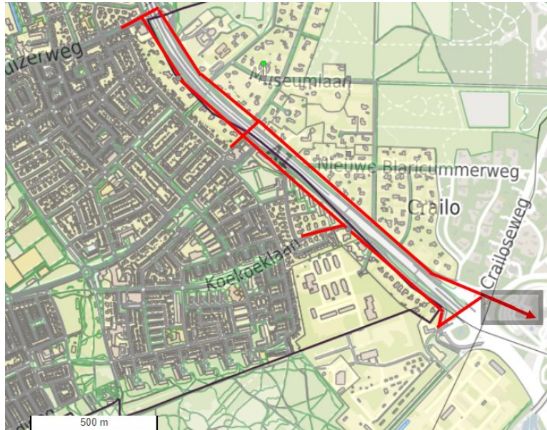
Figuur 1 Aanrijroutes fietsverkeer vanuit Bussum

Het voormalig ziekenhuis is gelegen direct ten noorden van de autosnelweg A1 in de gemeente Blaricum. Bij de inzet van Tergooi als onderwijshuisvesting gaat een deel van de leerlingen van het Goois Lyceum en het Vitus college vanuit Bussum naar Tergooi fietsen.