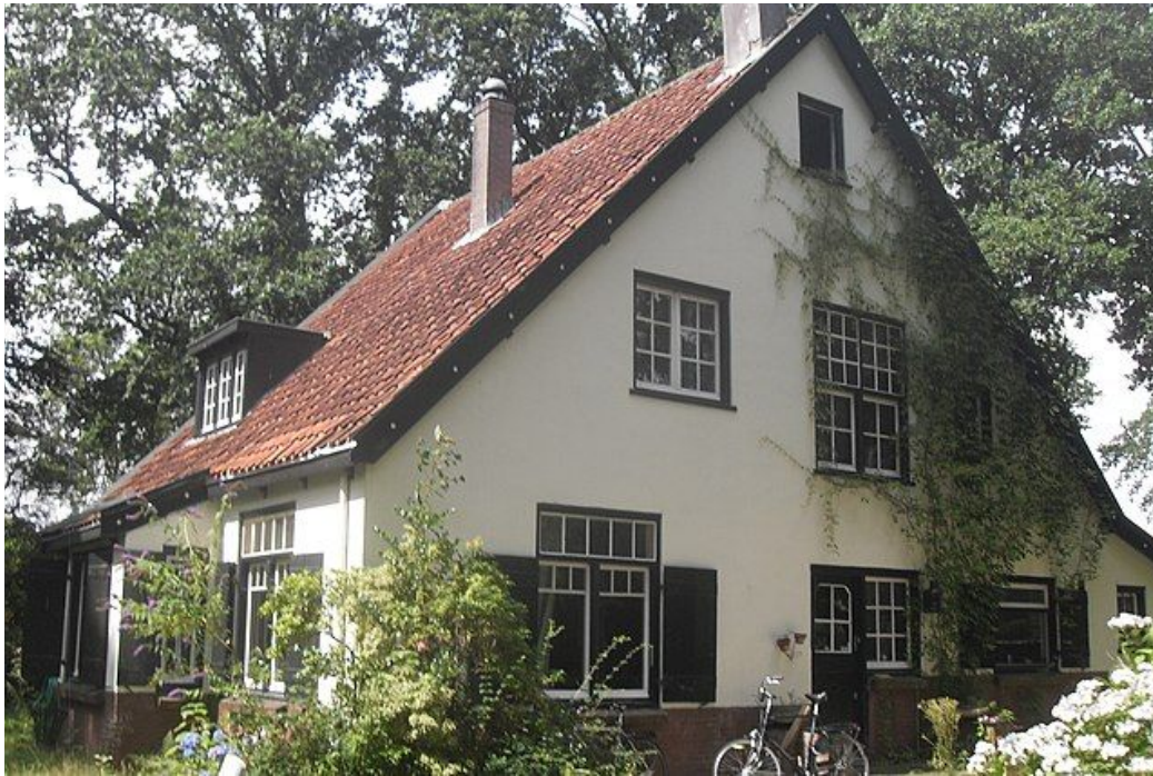
Vooraanzicht van de woning

Voor leden van de CRK&E vormen beschermen en ontwikkelen van monumenten geen tegenstelling, maar een inspirerende kans om monumentale waarden – principes in vormgeving – te beschermen door ze voort te zetten in vernieuwingsopgaven. De aanvraag voor dakkapellen en dakramen in een villa aan de Regentesselaan uit 1902 van architect Marius Bauer was vanuit de eigentijdse behoefte aan meer woongenot op de zolderverdieping begrijpelijk. Maar de voorgestelde symmetrische plaatsing en omvang ervan ontkende de essentie van de ‘Gooise landhuisstijl’ waarvan Bauer grondlegger is. De gesloten, heldere contour van het monument, met een nadrukkelijk dak en schijnbaar willekeurig geplaatste kleine vensteropeningen is kenmerkend. ‘Gegronde architectuur’ heet het, bewust ontworpen in de traditie van Gooise boerderijen op de kale zandgrond. Het vrijwel gesloten dak en kleine vensteropeningen bracht en verbeeldt beschutting. Aanvrager en architect zagen in hoe een symmetrische plaatsing en grote openingen afbreuk zouden doen aan de monumentale waarden en pasten hun ontwerp voor eigentijdse lichttoetreding aan de principes van de Gooise landhuisstijl aan.