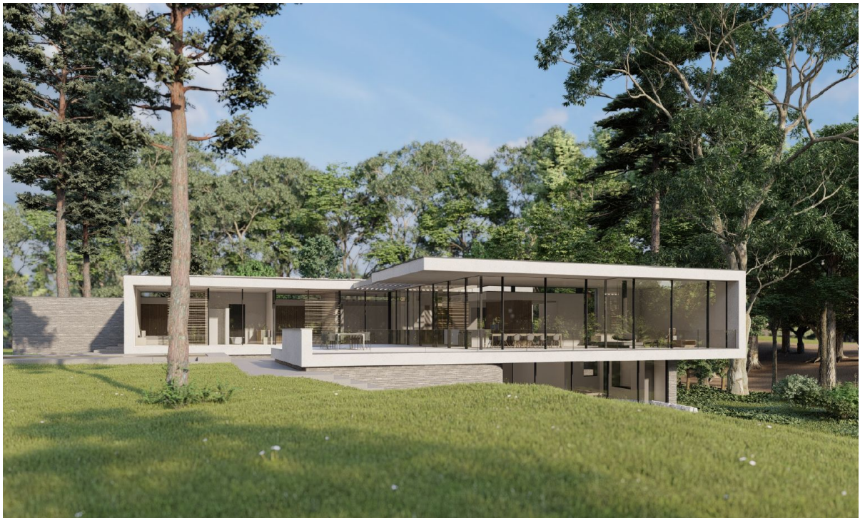
Afb. 1: Impressie van de nieuw te bouwen woning in bosgebied (2023), Maas Architecten.

In 2023 is een bouwplan voor het nieuw bouwen van een woning aan de commissie voorgelegd. De woning staat in gebied 23, Bosgebied en voor de inspiratie is gekeken naar Mies van der Rohe en Frank Lloyd Wright: een ambitieus plan. Het plan is eerst als conceptaanvraag ingediend. De commissie was toen gelijk van mening dat er veel potentie en kwaliteit in het ontwerp zat. Zij stelde dat conceptueel dit ontwerp kraakhelder diende te worden. Zij was van mening dat het ontwerp valt of staat met een sterke relatie tussen binnen- en buitenruimtes en een afleesbare correlatie tussen constructief en ruimtelijk concept enerzijds en een zorgvuldige materialisering en abstracte detaillering anderzijds ( less is more ). De wisselwerking tussen gesloten en open, horizontaliteit en ruimtelijkheid was erg goed geïntegreerd. Het plan is daarna verder uitgewerkt en ingediend als aanvraag omgevingsvergunning. De commissie heeft geoordeeld dat de hoge kwaliteit van het ontwerp en de zorgvuldige detaillering met een hoog abstractieniveau het mogelijk maakte om dit ontwerp te toetsen aan de algemene welstandscriteria in plaats van aan de gebiedsgerichte criteria.