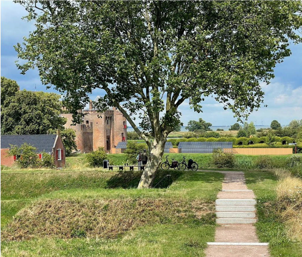
Zicht op Muider slot met het nieuwe horecapaviljoen (impressie, 2023).

Ook rijksmonument Muider slot gaat mee met de eigen tijd door een goed toegankelijk horecapaviljoen in de tuin te plaatsen. Deze tuin is een reconstructie van de 17 e -eeuwse tuin van P.C. Hooft, gelegen in de omwalling en onderdeel van het UNESCO werelderfgoed Hollandse Waterlinies. Dat vroeg binnen deze monumentale context om een uitermate zorgvuldige advisering; het werd een langdurig proces. Het uiteindelijke resultaat refereert aan een kas die de waarde van de omheinde tuin respecteert en de beleving van het slot met de vestingwerken niet onevenredig aantast. De kas wordt naar verwachting in 2024 opgeleverd.