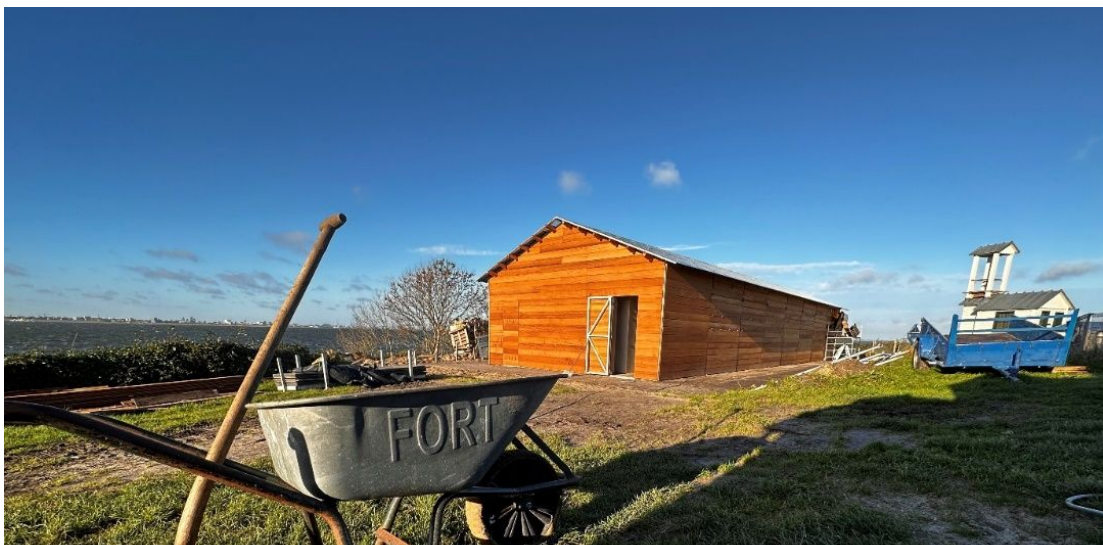
De gerealiseerde bergloods gezien vanaf het fort, behandeld in 2022 in de CRK&E, foto aangeleverd door Forteiland Pampus.

In het jaarverslag van 2022 is de commissie ingegaan op de omgevingsvergunning die was aangevraagd door Forteiland Pampus voor de bergloods. In 2023 is deze gerealiseerd. De door Pampus ingeslagen weg om het eiland geheel duurzaam en zelfvoorzienend te laten zijn, is een hedendaagse opgave, maar in lijn met de cultuurhistorie van dit eiland.