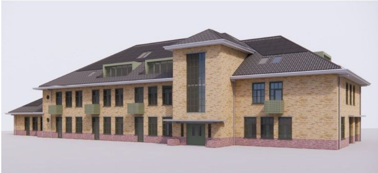
Ontwerp legeringsgebouw Kazernekwartier, behandeld in het Kwaliteitsteam Crailo, 2023.

Sinds januari 2023 maak ik deel uit van het kwaliteitsteam Crailo namens de CRK&E Gooisemeren. Het kwaliteitsteam beoordeelt plannen voor gebouwen en de inrichting van de openbare ruimte in het buurtschap Crailo en adviseert daarover. In 2023 heeft het kwaliteitsteam onder andere het plan van BPD voor de herbestemming van 4 legeringsgebouwen tot 86 woningen en commerciële ruimten begeleid en beoordeeld. Uitgangspunt voor de aanpak is behoud van de karakteristieke waarden.