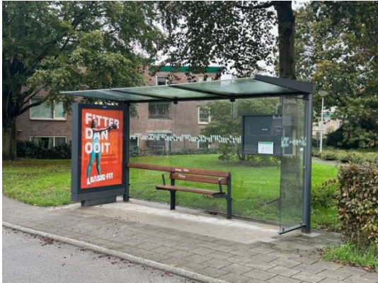
Abri met glazen dak