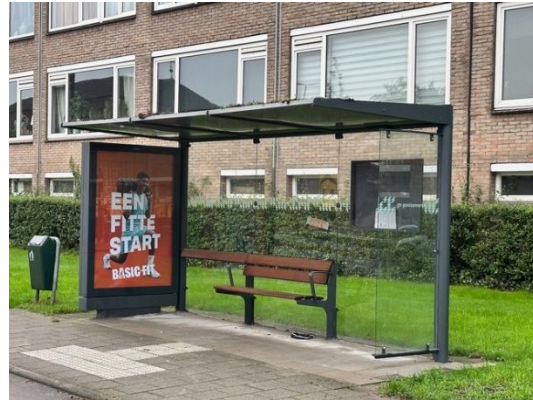
Abri met sedum dak

Bij de aanbesteding was voorzien dat op een 6 locaties vrijstaande reclamevitines geplaatst zouden worden waarvan 4 met een digitale zijde. Gelet op de verkeersveiligheid is echter besloten om af te zien van vrijstaande vitrines met digitale reclames.