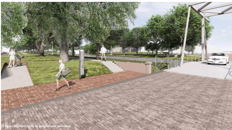
Beeld entree Amsterdamsestraat, pag.32 planbeschrijving.