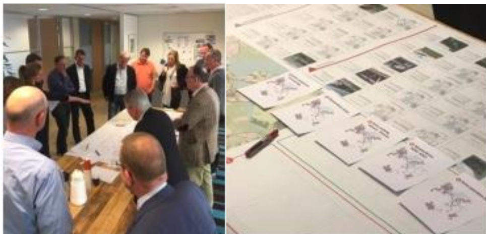
Afbeelding 2: Interactieve werksessies met raadsleden en wethouders

Het MIRT onderzoek staat volop in de belangstelling in Gooi en Vechtstreek. Vanaf het begin is de regio actief betrokken bij het onderzoek, wat een schat aan informatie heeft opgeleverd. Van data over vervoersbewegingen en de werkgelegenheid, tot inzicht in de bereikbaarheids-, economische en landschappelijke opgaven. Er zijn de afgelopen drie jaar verschillende interactieve bijeenkomsten georganiseerd met raadsleden, maatschappelijke organisaties en ondernemers, wat heeft geresulteerd in een gezamenlijk beeld van de toekomst van Gooi en Vechtstreek. Deze kennis is van grote meerwaarde in de context van de Regionale Samenwerkingsagenda en het regionale omgevingsbeeld (onderdeel van de Omgevingswet).