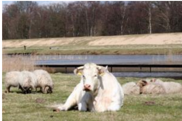
Zanderij Crailo tussen Hilversum en Bussum

Het landschapsbeeld is een feitelijk rapport, waarin het landschap van Gooi en Vechtstreek objectief staat beschreven en wordt gewaardeerd. De informatie komt uit diverse rapporten, onderzoeken en visies. Het landschapsbeeld geeft een overzicht van de relevante historische ontwikkelingen in het landschap, beschrijft het huidige landschap en hoe dit kan worden gewaardeerd. In de nog te realiseren landschapsvisie worden de keuzes uitgewerkt voor de toekomst van het landschap.