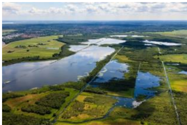
Het Naardermeer (zicht op Naarden en Bussum)