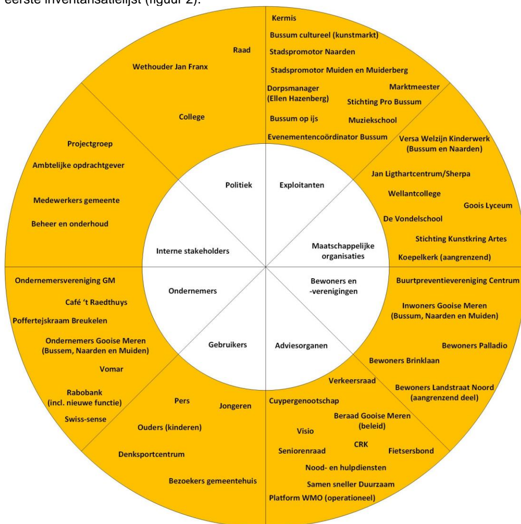
Figuur 2: overzicht stakeholders en doelgroepen (wit=doelgroepen, oranje=stakeholders binnen de doelgroep)

Alle doelgroepen moeten daarom ook de kans krijgen om hun bijdrage te leveren aan de totstandkoming van het nieuwe ontwerp van de nieuwe buitenruimte. Gestreefd wordt naar zo breed mogelijke vertegenwoordiging en draagvlak. Op basis hiervan zijn de volgende stakeholders (onderverdeeld in 8 doelgroepen) geïnventariseerd. Het betreft de eerste inventarisatielijst (figuur 2).