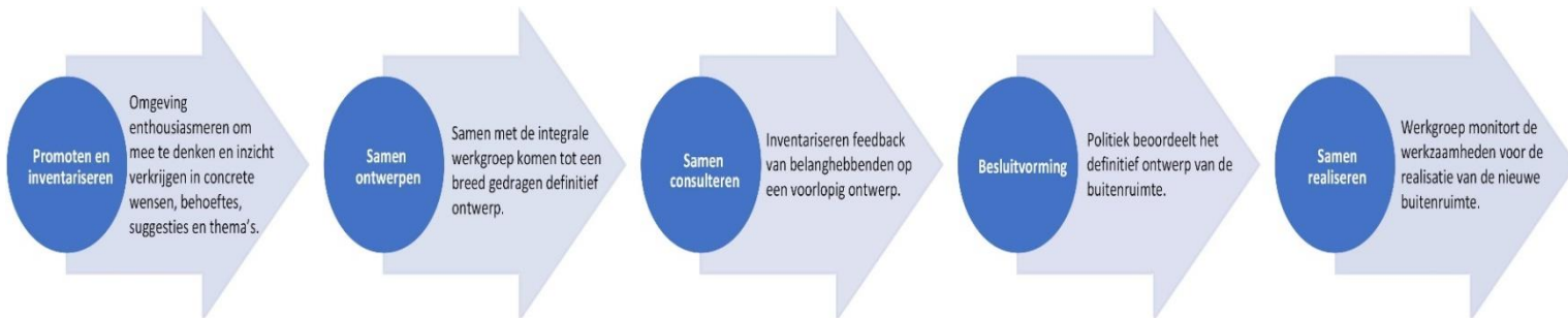
Figuur 3: participatiemodel buitenruimte

Aan deze participatie zullen de volgende werkgroepen en deelnemers actief zijn (voorlopige lijst):