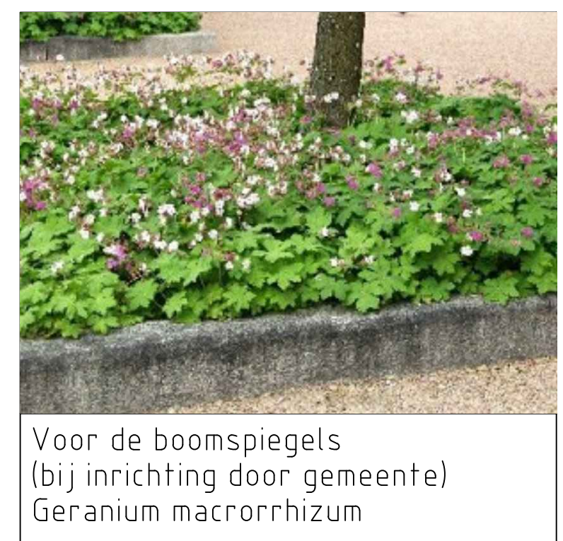
Voor de boomspegels (bij inrichting door gemeente) Geranium macrorrhizum