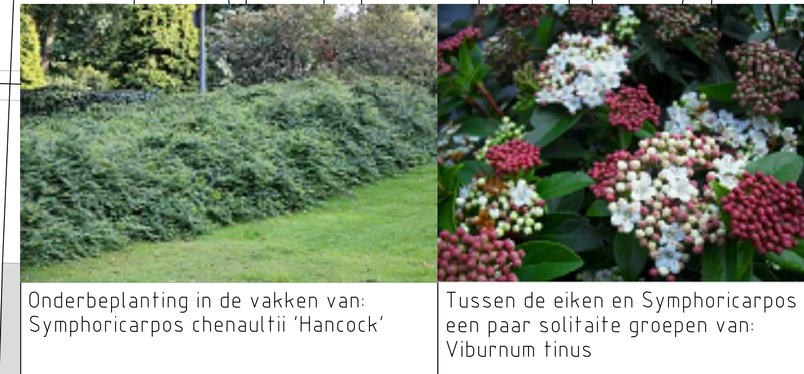
Onderbeplanting in de vakken van: Symphoricarpos chenaultii 'Hancock' Tussen de eiken en Symphoricarpos een paar solitaire groepen van: Viburnum tinus