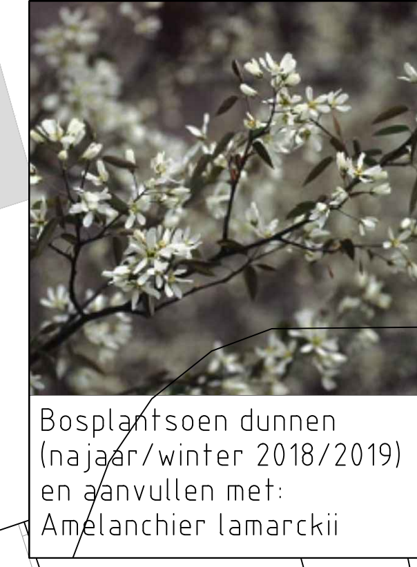
Bosplantsoen dunnen (najaar/winter 2018/2019) en aanvullen met: Amelanchier lamarckii