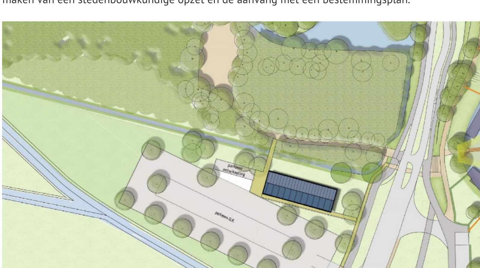
Afbeelding: schetsontwerp P1 en brandweerkazerne

Bij de vaststelling van de Visie Zuidwest is de locatie P1 (het parkeerterrein ten westen van de Vecht nabij het Muiderbos) aangemerkt als de voorkeurslocatie voor de bouw van de nieuwe brandweerkazerne. De bestaande kazerne zou dan weggaan op de huidige locatie aan de Weesperweg. Op deze locatie aan de Weesperweg zit ook een makelaar waar afspraken mee worden gemaakt voor herinrichting op deze plek. Dit afsprakenkader is nagenoeg afgerond en is een 1e stap om de ontwikkeling conform de visie mogelijk te maken. De vervolgstappen zijn het maken van een stedenbouwkundige opzet en de aanvang met een bestemmingsplan.