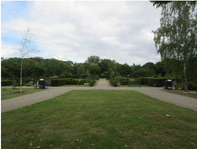
Hoofdas van plan Tersteeg richting natuurbegraafplaats