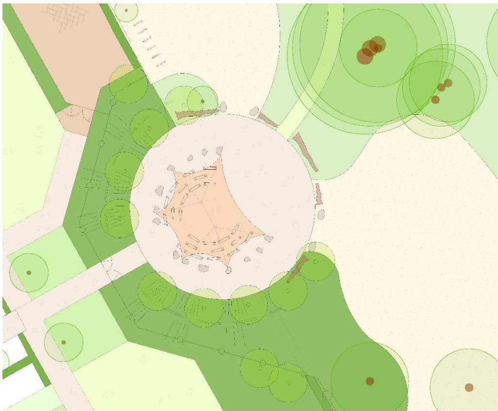
Detail ceremonieplein met tent