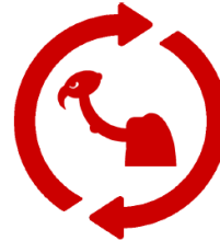
Closing the loop: Hoe zorgen we voor meer recycling?

Uw vraag over secundair materiaal betreft het Gier-aspect van circulair inkopen en er is pas sprake van echt / 100% circulaire opdrachten (proces-meting conform Roadmap MRA) als op alle vier de proces-onderdelen resultaten behaald zijn. Bij de nulmeting Circulair Inkopen en Opdrachtgeverschap over 2019 hebben we gezien dat we goed scoorden t.a.v. onze doelstelling. Over de hele MRA bekeken zien we dezelfde trend, echter bij allen (waaronder Gooise Meren) is contractmanagement het aandachtspunt voor de toekomst. Dit contractmanagement borgt dat wat contractueel is afgesproken ook daadwerkelijk gerealiseerd wordt door ondernemer, óók op het gebied van duurzaamheid. Op dit moment is dat slechts bij enkele circulaire contracten geborgd, waardoor het antwoord op de eerste vraag voorlopig nog ontkennend is. We kunnen wel een aantal voorbeelden geven van recente inkooptrajecten met Gier-aspecten erin verwerkt: