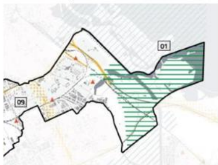
Kaart Concept RES