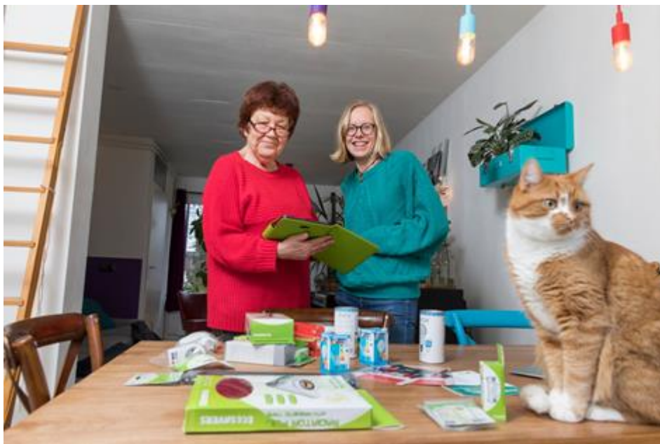
Afbeelding: Energiebesparing in Haarlem

lager inkomen; de voordelen moeten bij iedereen terechtkomen. Meerwijk is de eerste wijk waar een warmtenet wordt aangelegd. Verder steunt Haarlem wijkinitiatieven om gasvrij te worden. In het Ramplaankwartier zijn inwoners samen met de gemeente en TU Delft al ver in een gasvrije wijkoplossing.