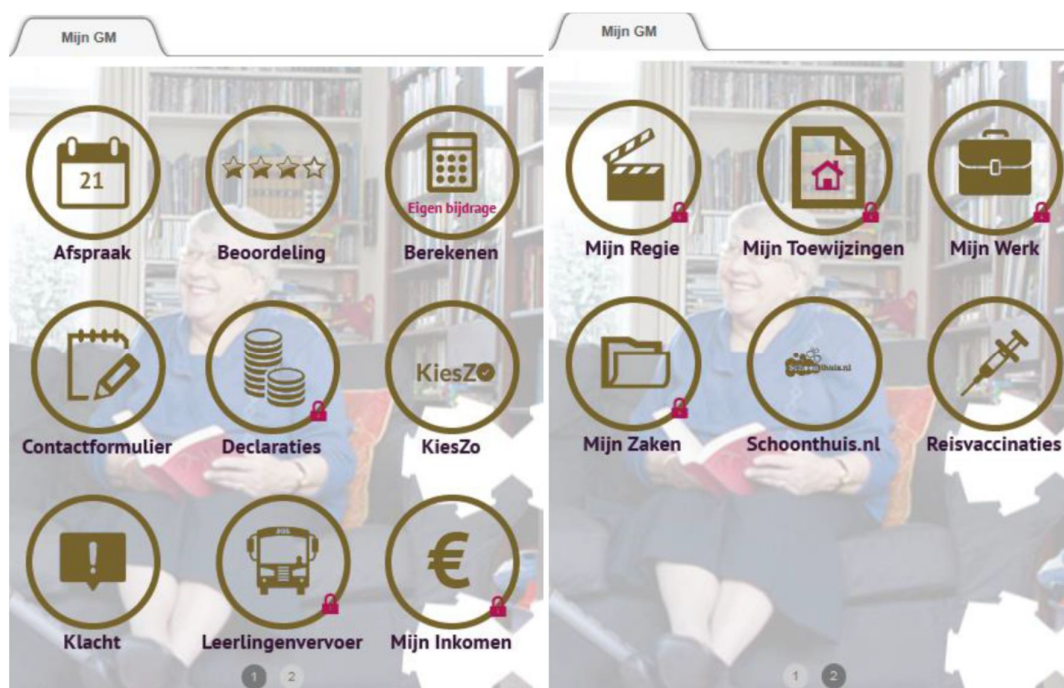
Figuur 2 Voorbeeld inwonerportaal 'Mijn Gooise Meren'

Figuur 2 geeft een indruk hoe het inwonerportaal er uiteindelijk uit kan komen te zien, met alle mogelijke functies. In 2017 zullen alleen nog de functies 'mijn ondersteuning (toewijzingen)', 'klacht' en de mogelijkheid tot waarderen operationeel zijn.