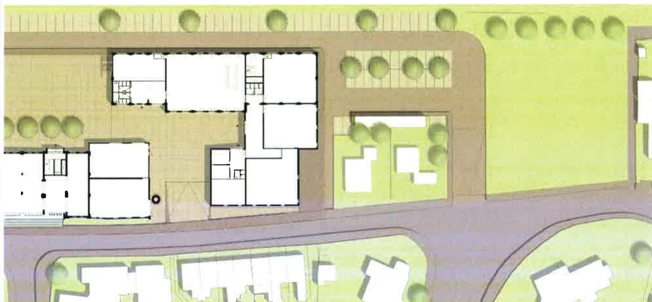
Figuur: uitsnede uit plattegrond project Bensdorp van de informatieavond op 25 augustus 2015.

In de informatieavond van 25 augustus 2015, waarin het bestemmingsplan met het ontwerp voor de Bensdorp werd toegelicht is aangegeven dat de te slopen fabriekshal aan de zuidzijde van het plangebied grenzend aan het Geitenweitje, vervangen zal worden door kavels van woningen. In eerste instantie werd gedacht aan drie woningen (twee woningen onder één kap en één vrijstaande woning). Op de informatieavond is aangegeven dat er sprake is van twee vrijstaande woningen.