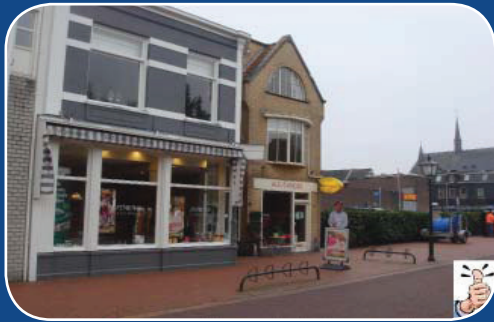
Sterk: Beeldbepalend pand