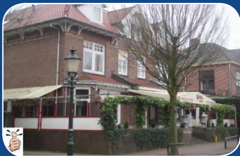
Sterk: Goede overgangen