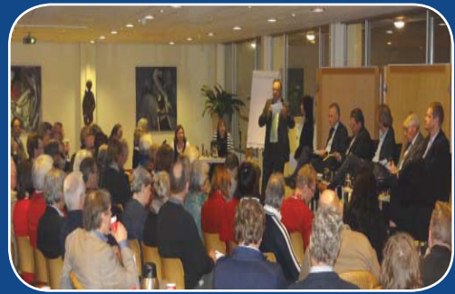
Impressie eerste avond