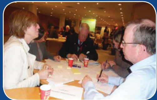
Impressie tweede avond