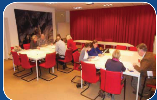
Impressie tweede avond

porten en onderzoeken die de deskundigen hebben ingebracht, zijn gebruikt om daaruit deze toekomstvisie voor het centrum van Bussum te formuleren.