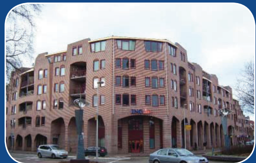
Hoek Kerkstraat en Landstraat