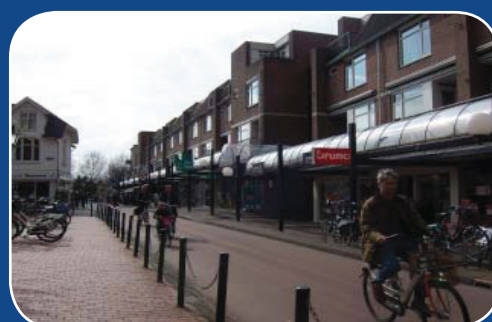
Fietsen in Bussum

enige discussie werd geconcludeerd dat Bussum in verhouding tot de rest helemaal geen auto is, maar een fiets: Bussum heeft een gevarieerde, hoog opgeleide bevolking, maar men is 'normaal' gebleven. Bussumers staan met beide benen op de grond, vinden duurzaamheid belangrijk en nemen veelal gewoon de fiets.