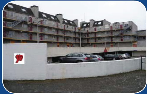
Zwak: Lelijke achterkanten

Op het gebied van mobiliteit is er ook wat ontevredenheid. Er is te veel (doorgaand) verkeer, vinden een aantal bewoners. Ook de splitsing van Bussum door een spoorlijn wordt als vervelend ervaren. Het is een fysieke tweedeling en zorgt voor opstoppingen in het verkeer. Bovendien mist het centrum voldoende stallingsmogelijkheden voor fietsen, waardoor het nu vaak rommelig is. Ook wordt als belangrijk zwak punt van Bussum genoemd dat er in het centrum te weinig horeca is en een gebrek aan woningen, vooral voor jongeren en ouderen. Er is dus onvoldoende levendigheid in het centrum.