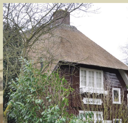
Rieten kap als bijzonder accent