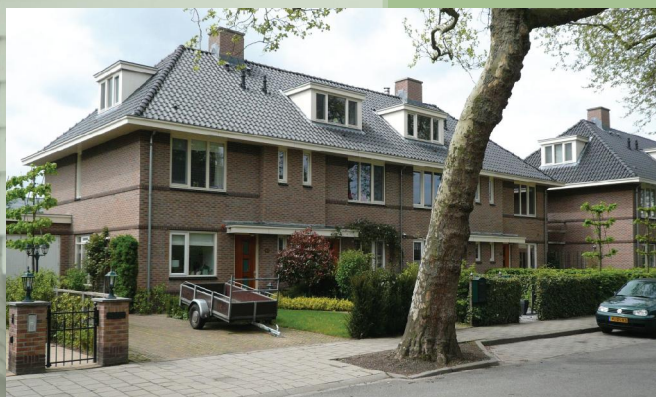
Samenhang in bouwmassa, nieuw