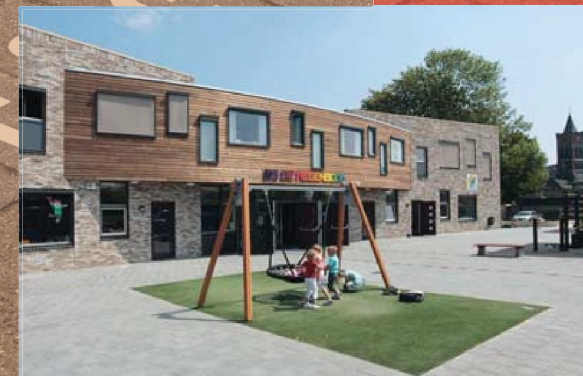
Ritmiek van ramen