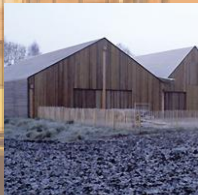
Bijgebouwen agrarisch van uitstraling