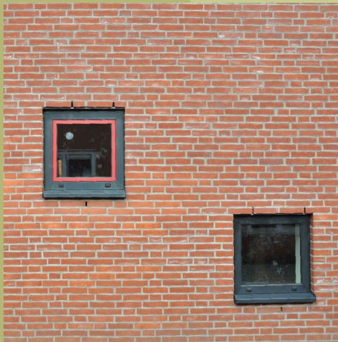
Huidige vormtotaal in de gevel van de Godelindeschool

In hoofdstuk 3 van dit rapport wordt de positie van het Beeldkwaliteitplan omschreven t.o.v. de overige beleidsplannen. Hoofdstuk 4 geeft een omschrijving van de omgeving waarbinnen het projectgebied valt. Dit hoofdstuk gaat tevens in op de tot standkoming van de stedenbouwkundige proefverkaveling. Hoofdstuk 5 geeft een beschrijving van de huidige beeldkwaliteit van de gebieden zoals deze zijn vastgelegd in de Welstandsnota waarbinnen het projectgebied valt. Hoofdstuk 6 omschrijft de criteria (harde en zachte) voor de uitwerking van de stedenbouwkundige- en architectonische aspecten van het plan. Hoofdstuk 7 omschrijft de beeldkwaliteit voor de inrichting van het openbaar gebied.