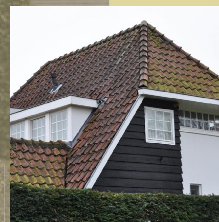
Combinatie met houten delen / stucwerk