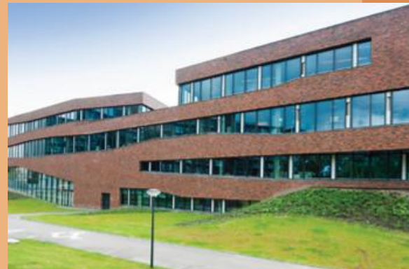
Glas en baksteen