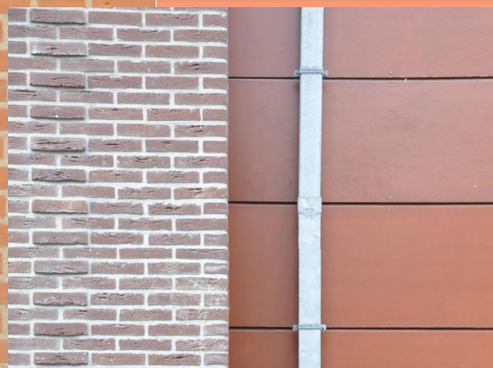
Plasticiteit in roodbruine bakstenen