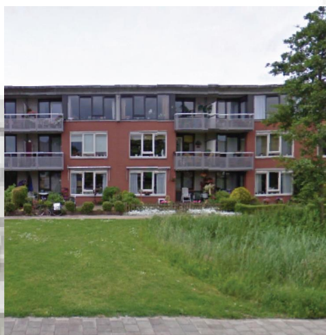
Complexen staan vrij op de kavel