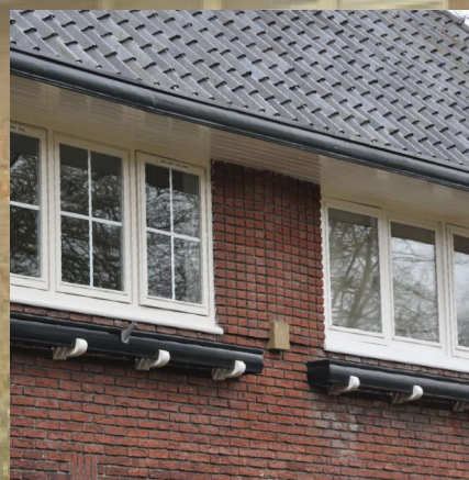
Raampartijen direct onder daklijn