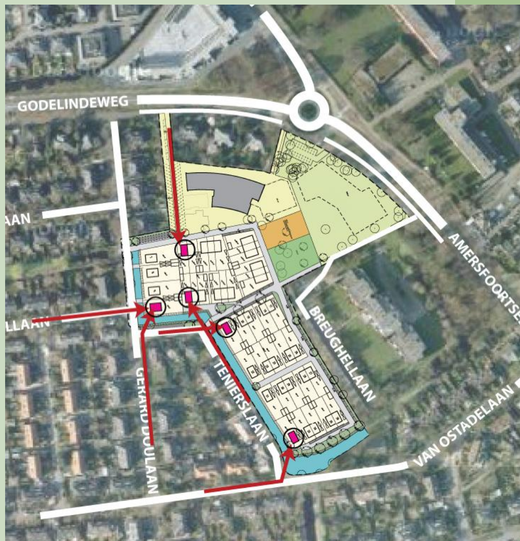
Markante plekken (zichtassen vanuit de omgeving naar de wijk)