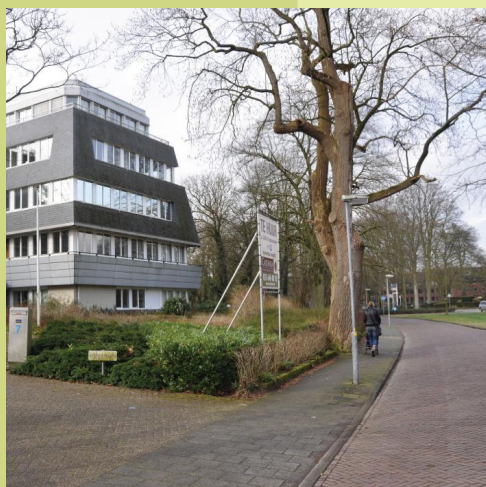
Huidige situatie Storkgebouw

Het Stedenbouwkundig Programma van Eisen voor de Stork-locatie is door de gemeenteraad van Naarden vastgesteld op 29 januari 2014. In samenwerking met omwonenden is een plan tot stand gekomen dat de basis vormt voor het Bestemmingsplan en het Beeldkwaliteitplan. Deze samen zijn op hun beurt weer de basis voor verdere uitwerking van de Bouwplannen en het Inrichtingsplan voor de openbare ruimte.