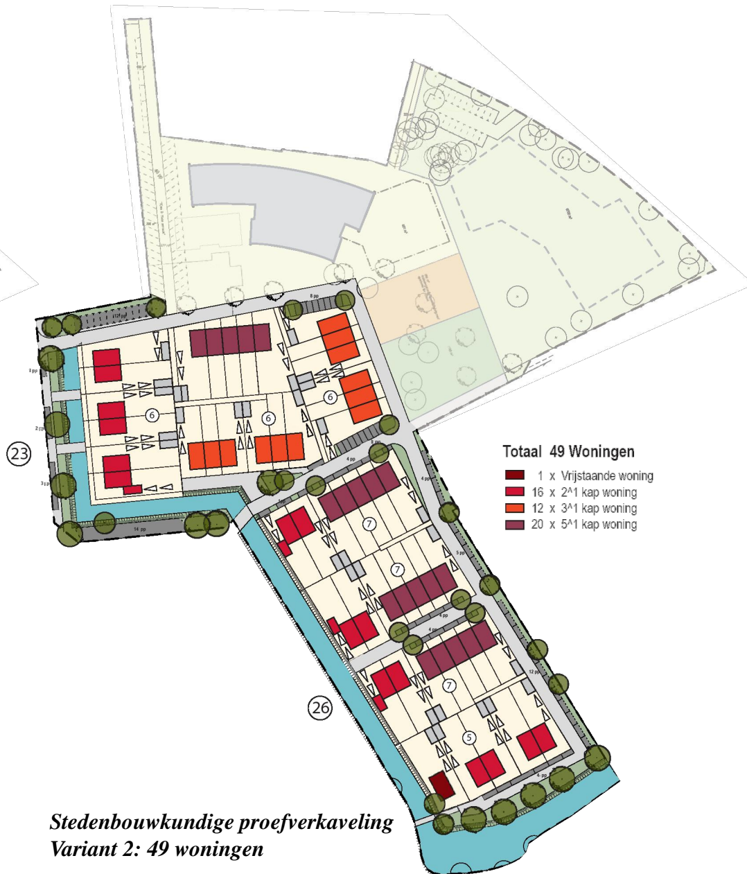
Stedenbouwkundige proefverkaveling Variant 2: 49 woningen