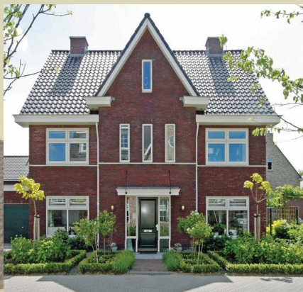
Oriëntatie op weg