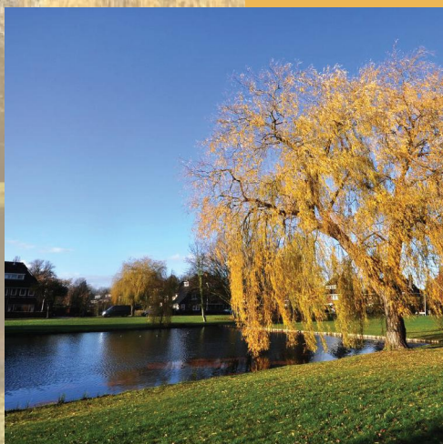
Bestaande vijverpartij in het Rembrandtkwartier