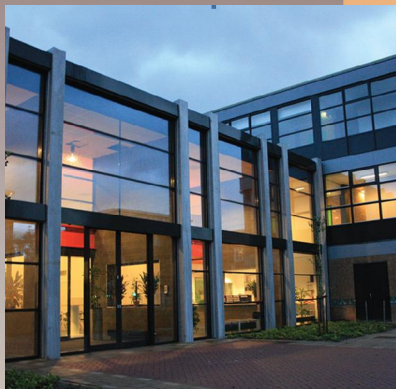
Constructie als onderdeel van het gevelbeeld