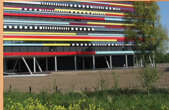
Kleur als accenten