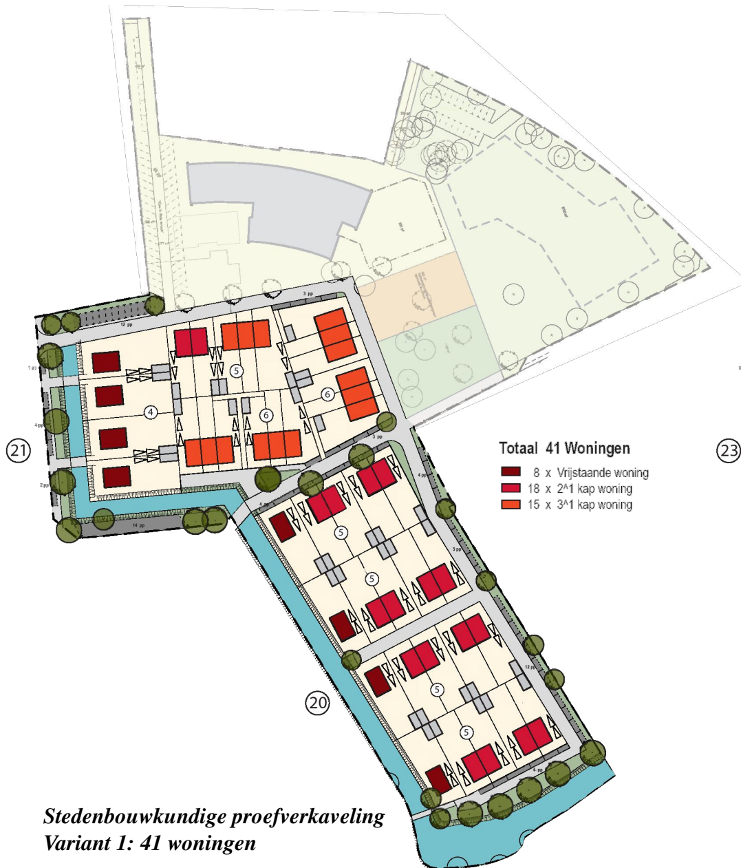
Stedenbouwkundige proefverkaveling Variant 1: 41 woningen