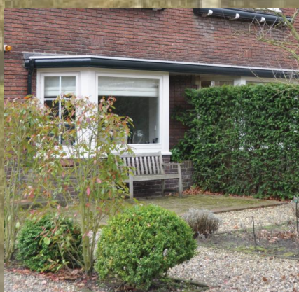
Doorlopende luifel van erker