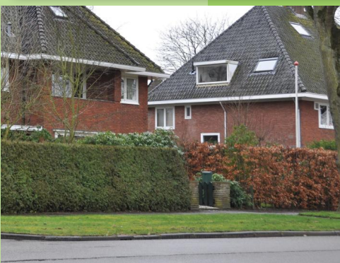
Groene erfafscheiding, wisselend in soort