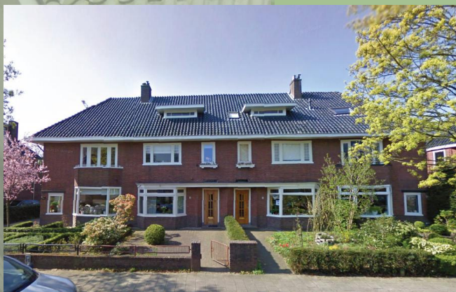
Samenhang in bouwmassa, orgineel