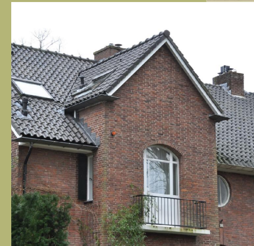
Impressie van de aanwezige bebouwing in het Rembrandtkwartier, ten zuiden gelegen van de Stork-locatie