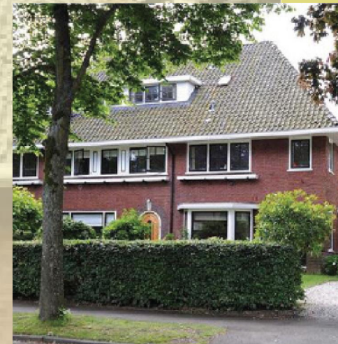
Samenhang in bouwvolume