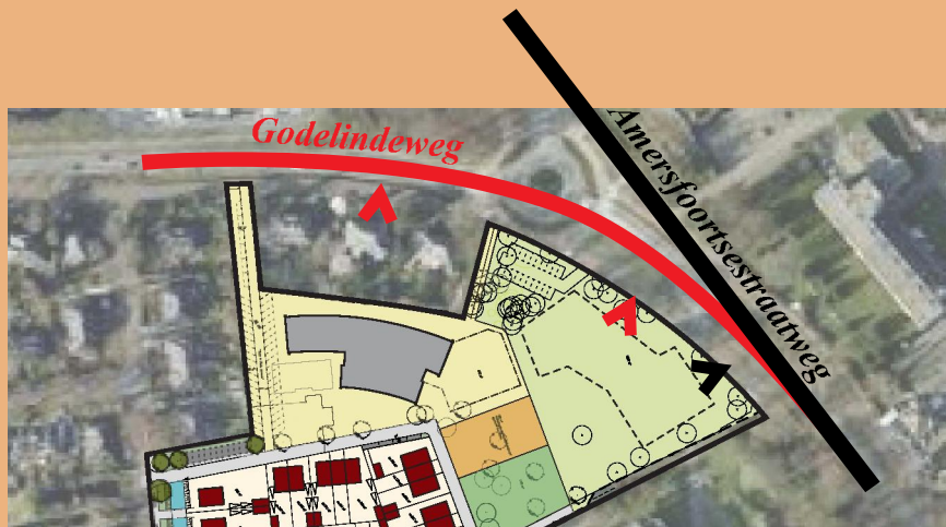
Oriëntatie van volume op Amersfoortsestraatweg / Godelindeweg