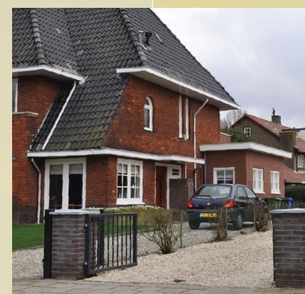
Horizontale geleding met verticale accenten