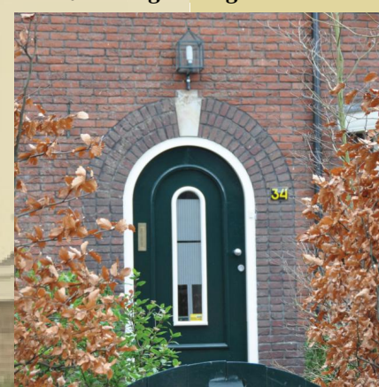
Siermettselwerk en traditionele kleuren