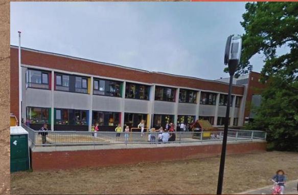
Omhullende bakstenen gevel