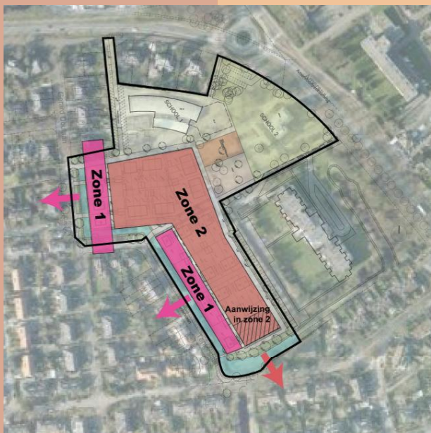
Zonering 1 en 2 met aanwijzing

De structuur van het plan en de richting van de verkaveling liggen vast. Binnen de structuur kan het aantal woningen per zone en per bouwveld flexibel ingevuld worden. De proefverkavelingen op de linker pagina tonen een combinatie van verschillende typologiën in een zelfde ruimtelijke opzet. Er zijn vele verschillende ruimtelijke uitwerkingen mogelijk.