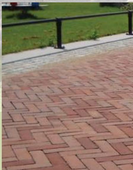
Impressie materialisering openbare ruimte