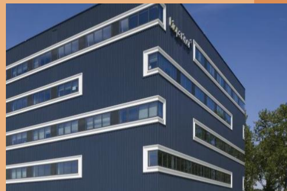
Sterke horizontale geleiding