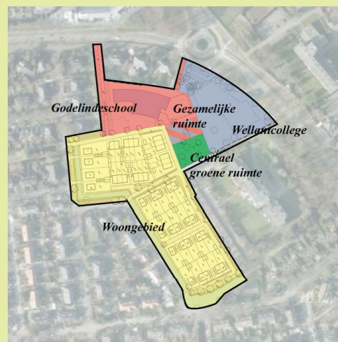
Toekomstige functies in plangebied