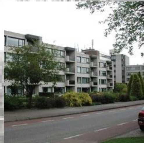
Liftekokers en trappenhuisen als bouwvolume