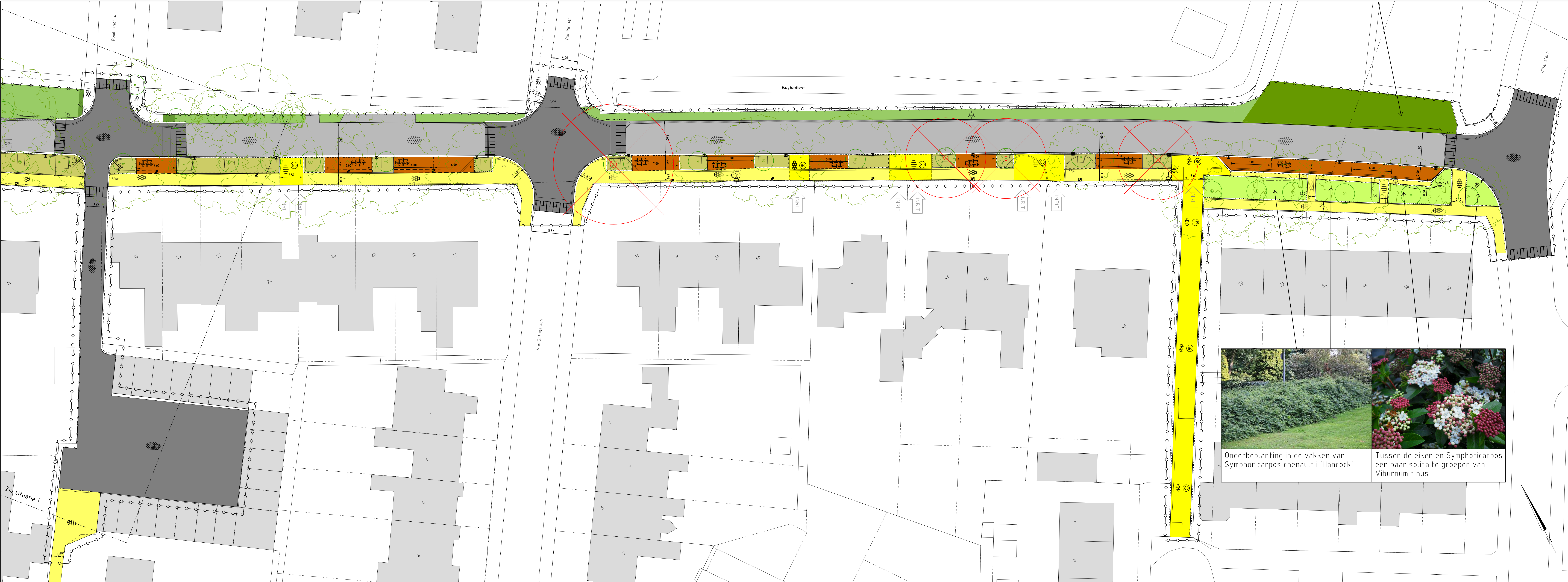
SITUATIE 2 Schaal 1:200