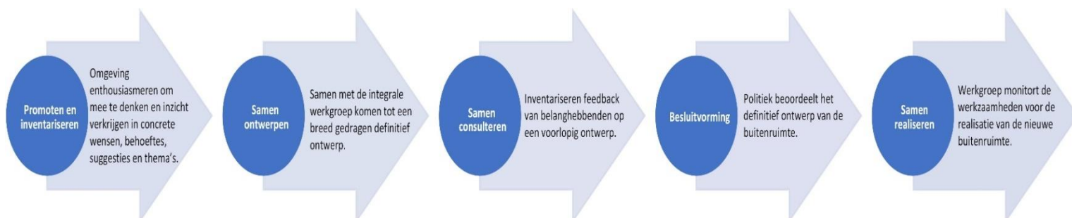
Figuur 3: participatiemodel buitenruimte

Aan deze participatie zullen de volgende werkgroepen en deelnemers actief zijn (voorlopige lijst):