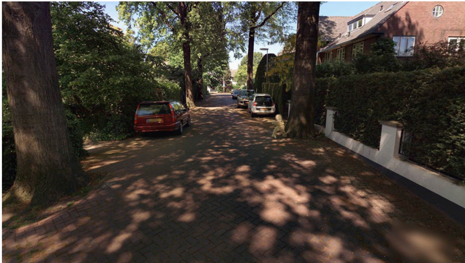
Bestaande situatie - Eikenlaan