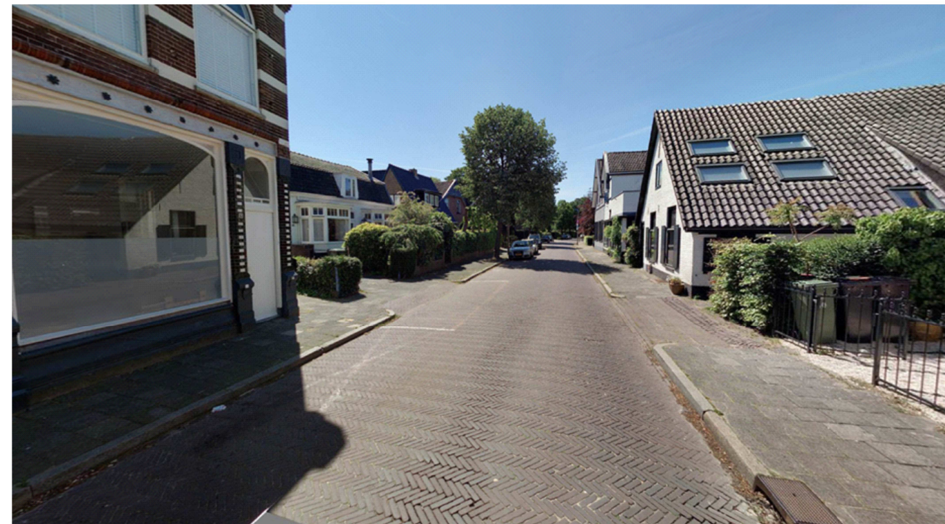
Bestaande situatie - Herenstraat