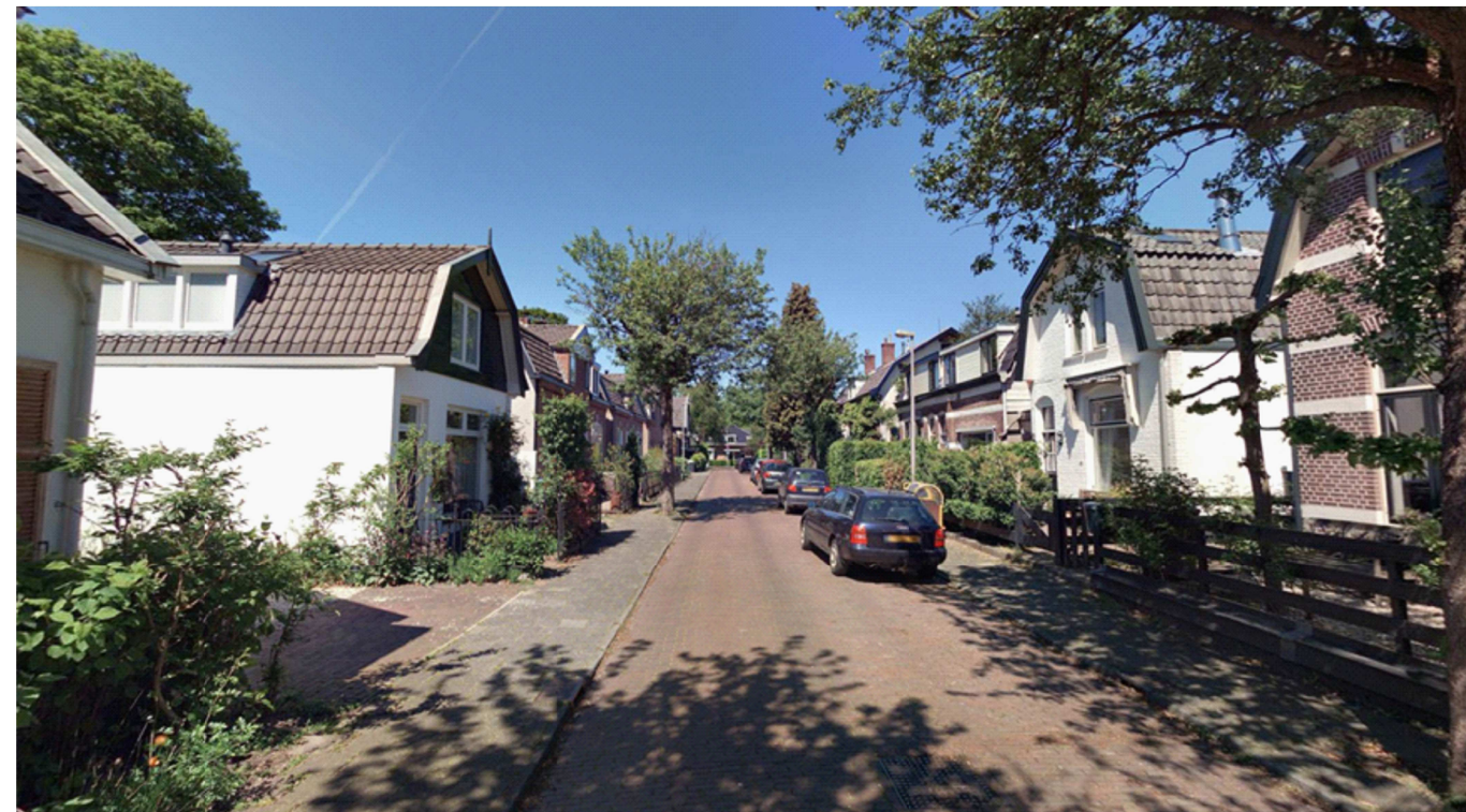
Bestaande situatie - Melkweg