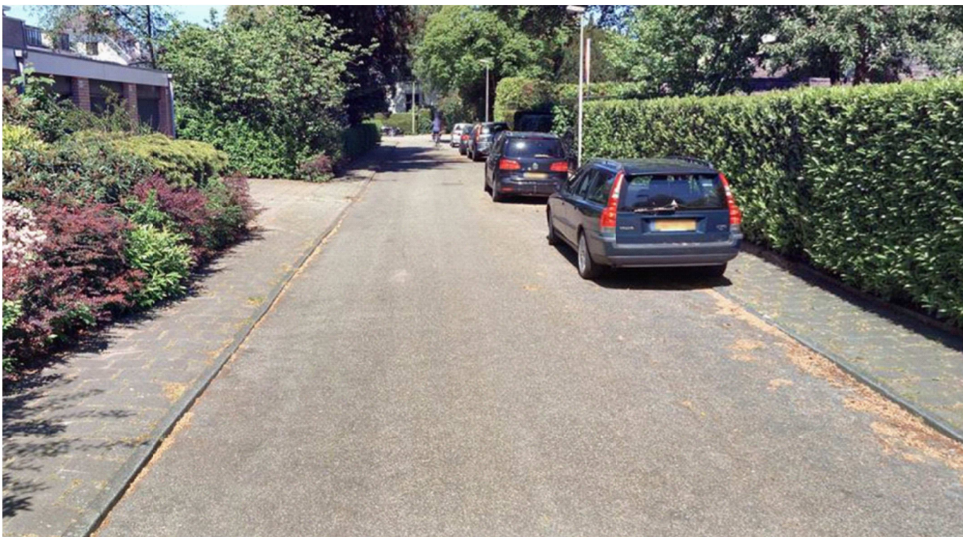
Bestaande situatie - Willemsslaan