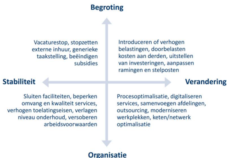
Figuur 1: matrix met vier perspectieven om de balans in de begroting te herstellen.

Door deze constatering met elkaar te combineren ontstaan er vier perspectieven op bezuinigen. Doordat we ook kijken naar inkomstenverhogende maatregelen spreken wij niet zozeer over bezuinigingen maar over het herstellen van de balans in de begroting. De resultaten uit het onderzoek leiden tot de volgende matrix: